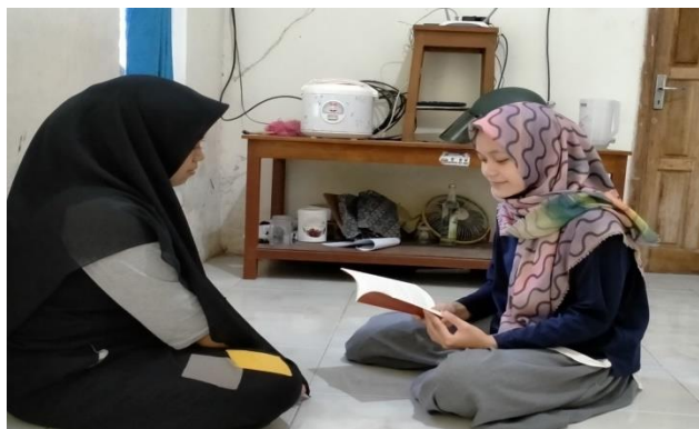
Gambar 6 wawancara dengan subjek YK