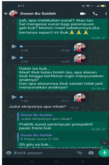
Gambar 4 hasil chat whatsapp subjek SP