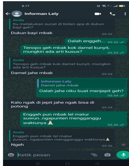
Gambar 2 wawancara dengan subjek SR