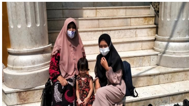
Gambar 5 wawancara dengan subjek DW