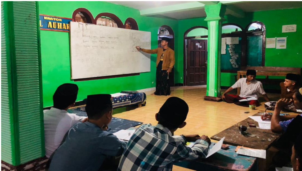
5.3 kegiatan musyawarah