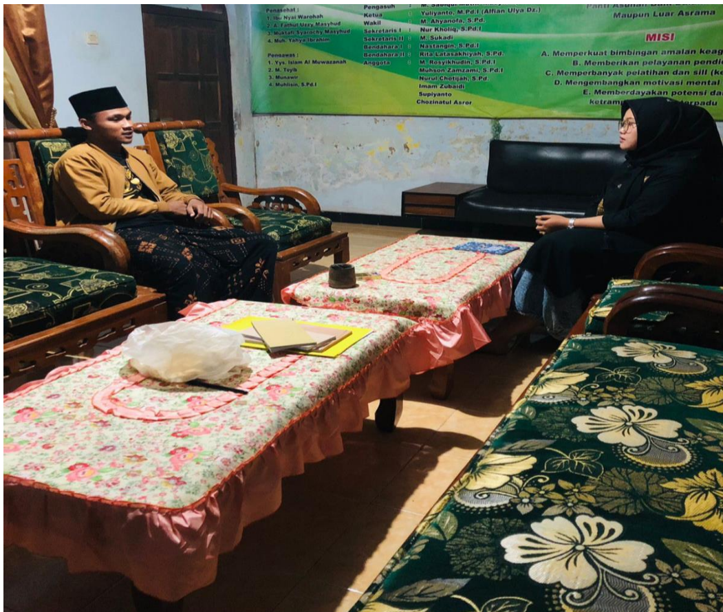
5.4 wawancara dengan salah satu putra pengasuh