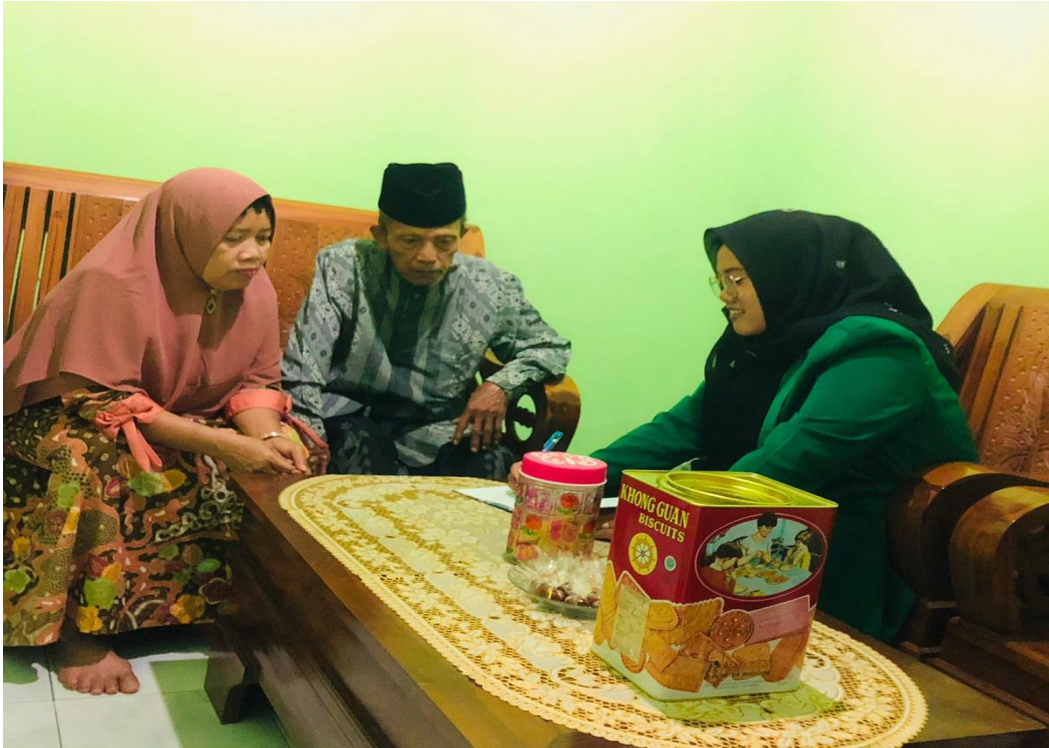
5.5 wawancara dengan salah satu pengasuh pondok