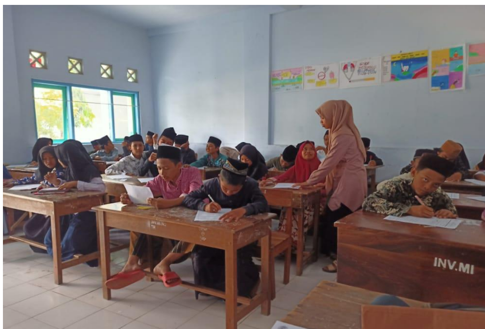
5.2 kegiatan belajar di Madrasah