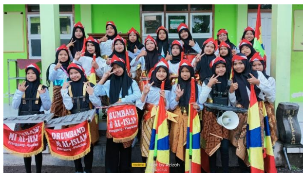
Kegiatan Drum Band MI Al-Islam Pranggang