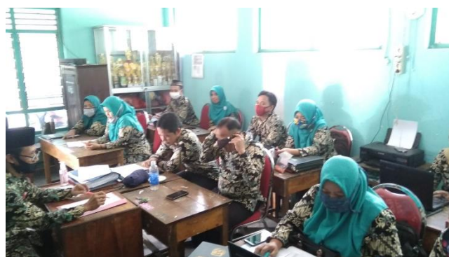
Kegiatan rapat guru dan karyawan MI Al-Islam Pranggang