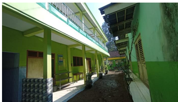
Gedung kelas MI Al-Islam Pranggang