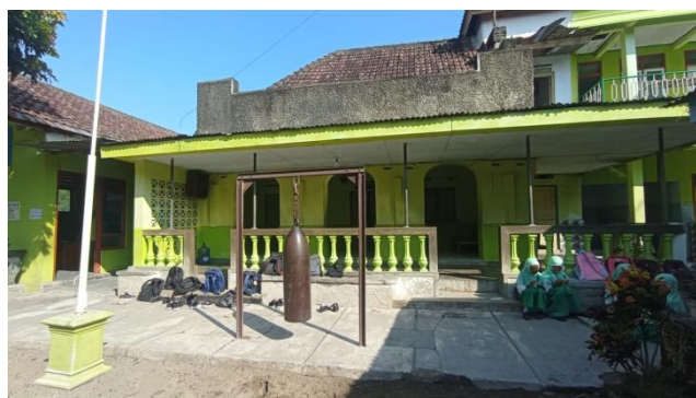
Musholla MI Al-Islam Pranggang