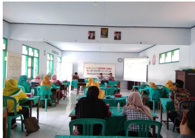
Pembinaan metode mengaji ummi oleh dewan guru MI Al-Islam Pranggang