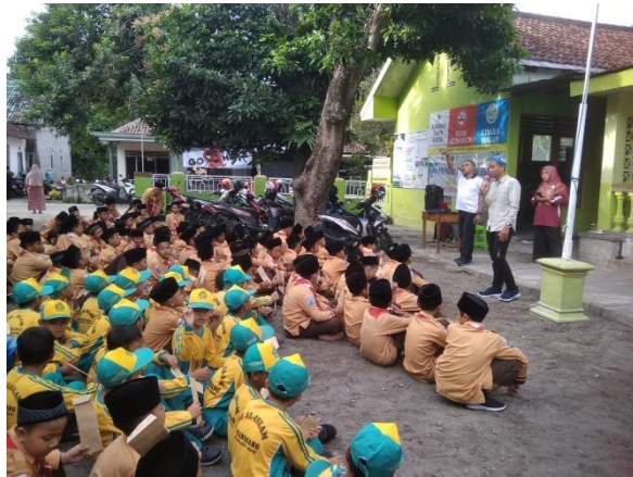
Kegiatan Pramuka MI Al- Islam Pranggang