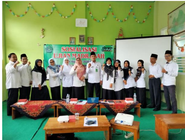
Sosialisasi dan pembinaan guru MI Al-Islam Pranggang