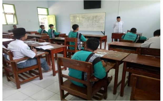
Pembelajaran Menggunakan modul yang dibuat oleh gurusebagai bahan ajar untuk siswa