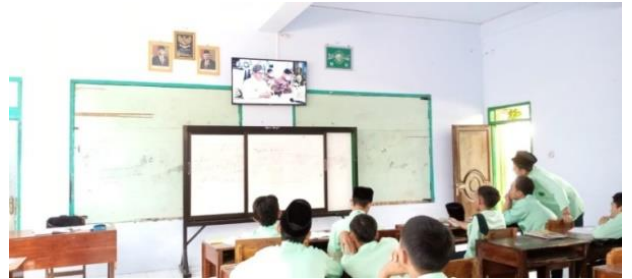
Pembelajaran menggunakan media smart tv