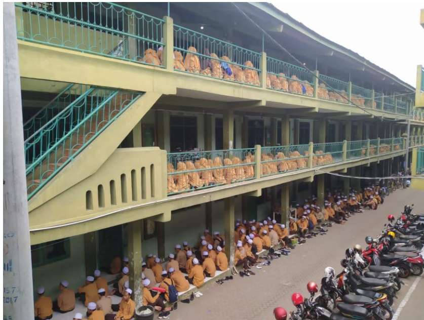
Tawasul Kepada Kyai Lirboyo sebelum KBM dimulai