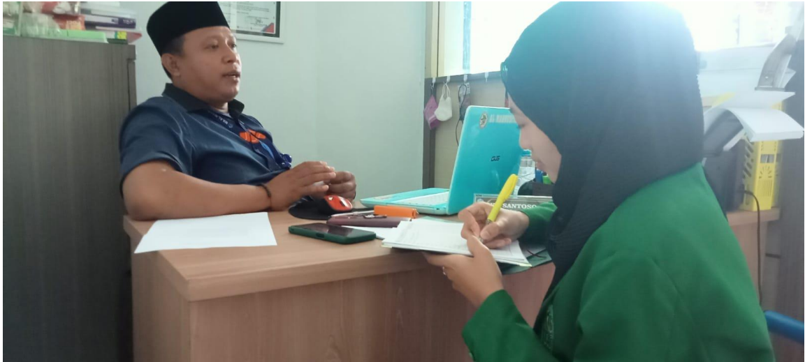
Wawancara dengan Waka Kesiswaan MA Al Mahrusiyah