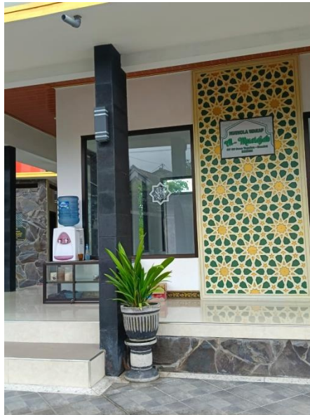
(Tempat Majelis Taklim Al-Mustajab dilaksanakan)