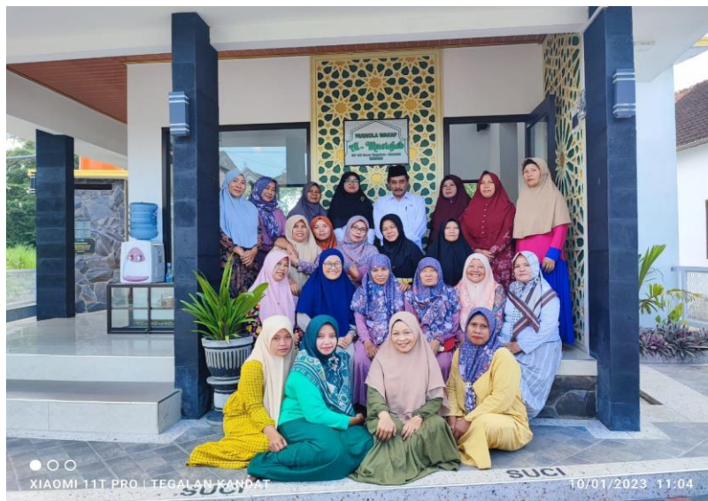
(Dokumentasi Dengan Ibu-ibu Jama'ah Majelis Taklim Al-Mustajab dan Bapak Penyuluh)