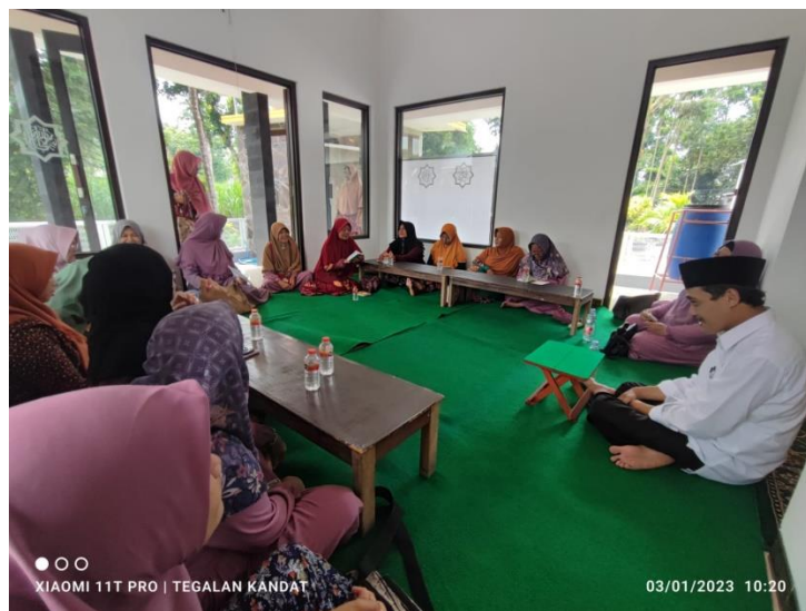
(Dokumentasi Kegiatan Penyuluhan Majelis Taklim Al-Mustajab)