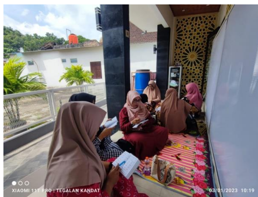
(Dokumentasi Kegiatan BMQ Majelis Taklim Al-Mustajab)