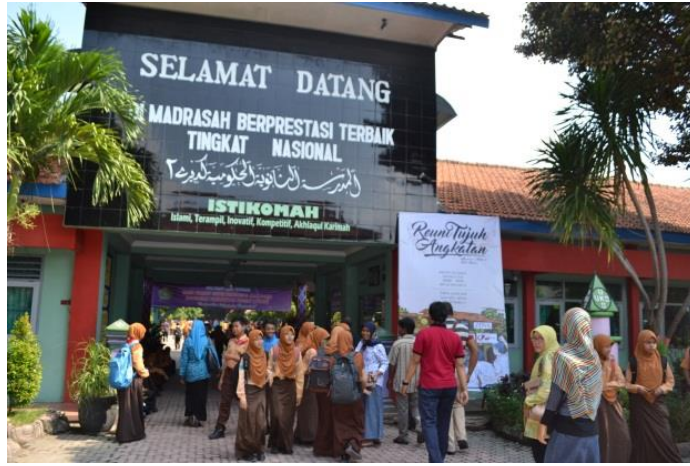
صورة ٣. المدرسة الثانوية الإسلامية الحكومية الثانية كديري

إن مجتمع البحث هو جميع الأفراد أو الأشخاص أو الأشياء الذي يكون موضوع مشكلة البحث، والعينة هي جزء من مجتمع البحث الأصلي. ٧٥ ومحل البحث هي المدرسة الثانوية الإسلامية الحكومية الثانية كديري. وبعنوانها في الشارع سونان امبيل رقم ١٢ عروغو مدينة كديري. لأن المدرسة الثانوية الإسلامية الحكومية الثانية كديري إحدى المدارس الثانوية المشهورة والكبيرة. فطبعاً، كان النجاح هذه المدرسة يتعلق بمهارة والنجاح طلابها. ويتأثر جداً مع تطوير نموذج اللعبة التربوية في تعليم اللغة العربية لتنمية المفردات للطلاب.