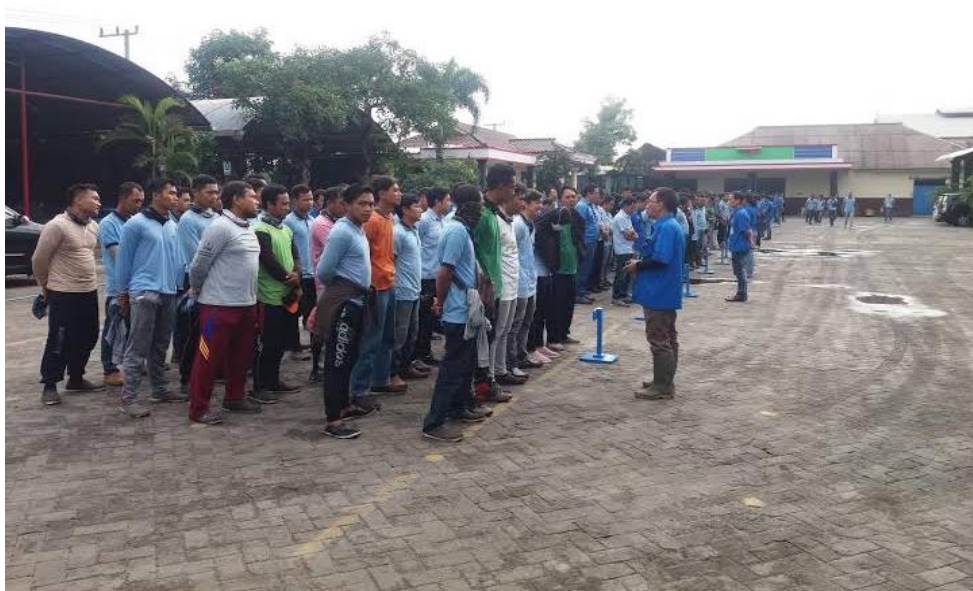
Kegiatan Briefing sebelum pekerjaan dimulai