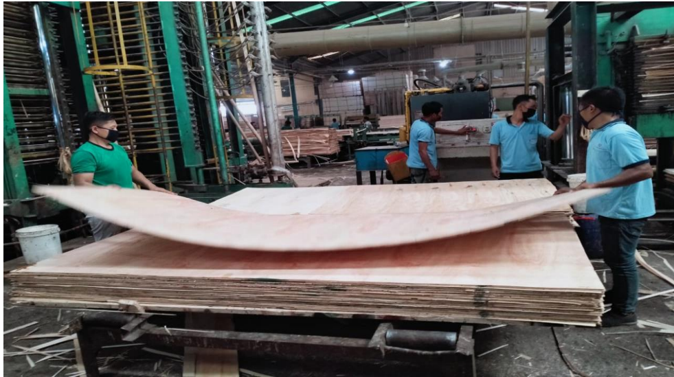
Dukungan antar karyawan (Kerja sama)