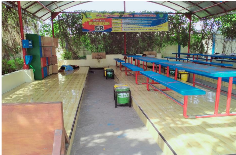
Tempat Istirahat karyawan (Slogan 5 R)