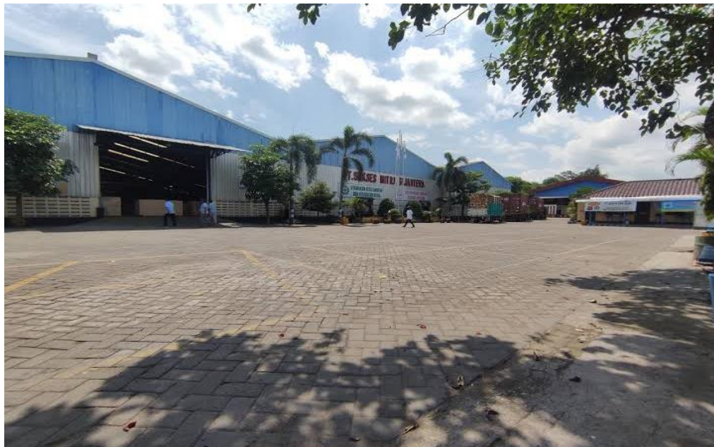
Halaman PT. Sukses Mitra Sejahtera