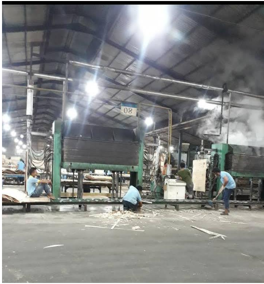
Kegiatan Membersihkan Limbah Sebelum Pulang