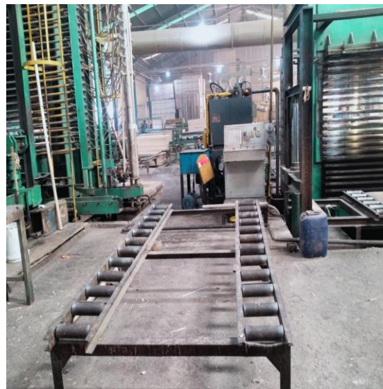
Keleluasaan Tempat Produksi