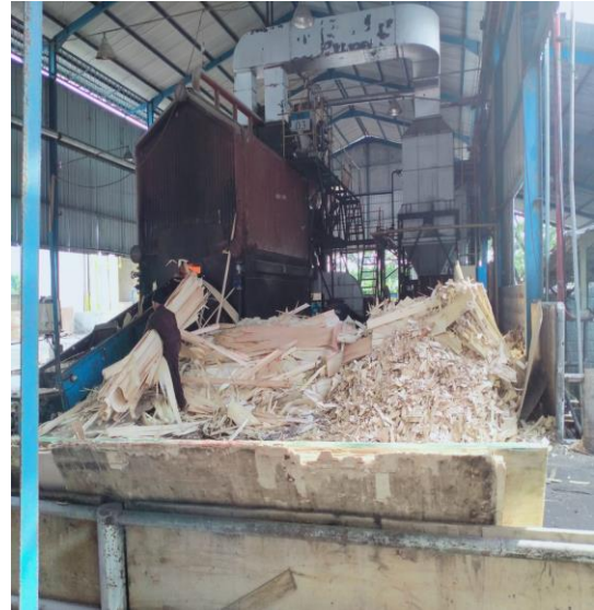
Tempat Pembuangan Limbah (Mesin boiler)