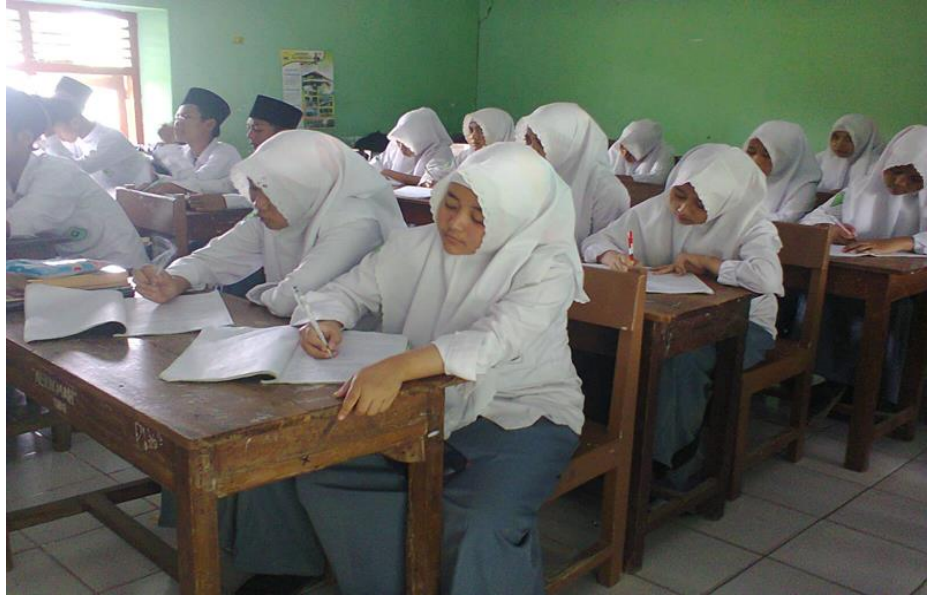
عملية التعليمية المواد المحادثة العربية في الفصل