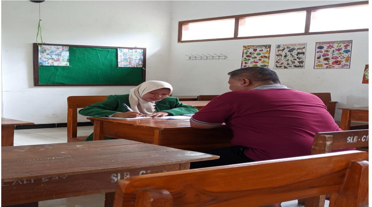
Kondisi gedung SLB Nurul Ikhsan Ngadiluwih