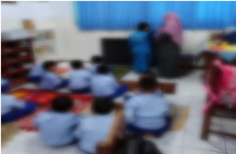
Gambar Pembelajaran ABK Praktik adzan SD Plus Rahmat Kediri