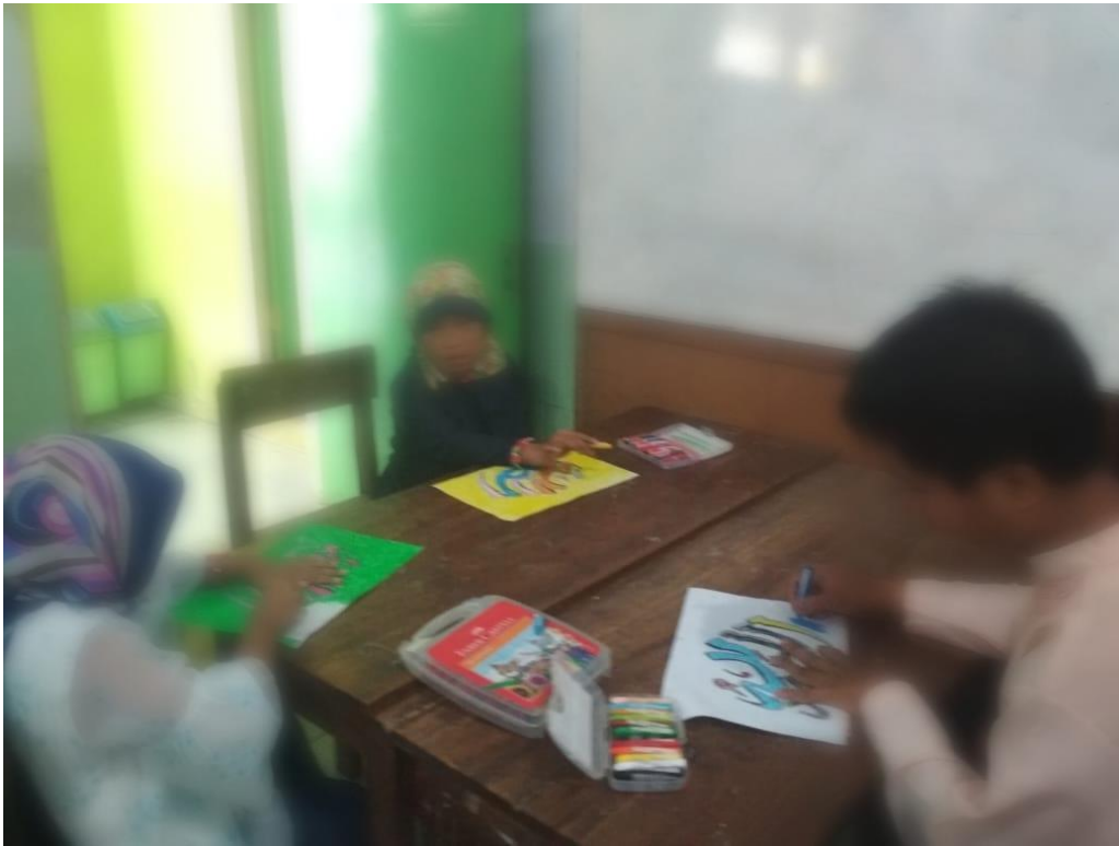
Gambar Pembelajaran ABK Praktik membuat kaligrafi SDN Burengan 5 Kediri