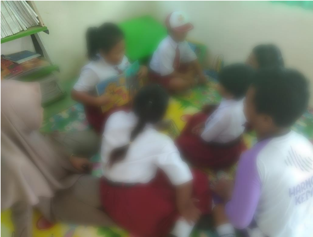
Gambar Pembelajaran ABK dengan bantuan tutor sebaya SDN Nurengan 5 Kediri