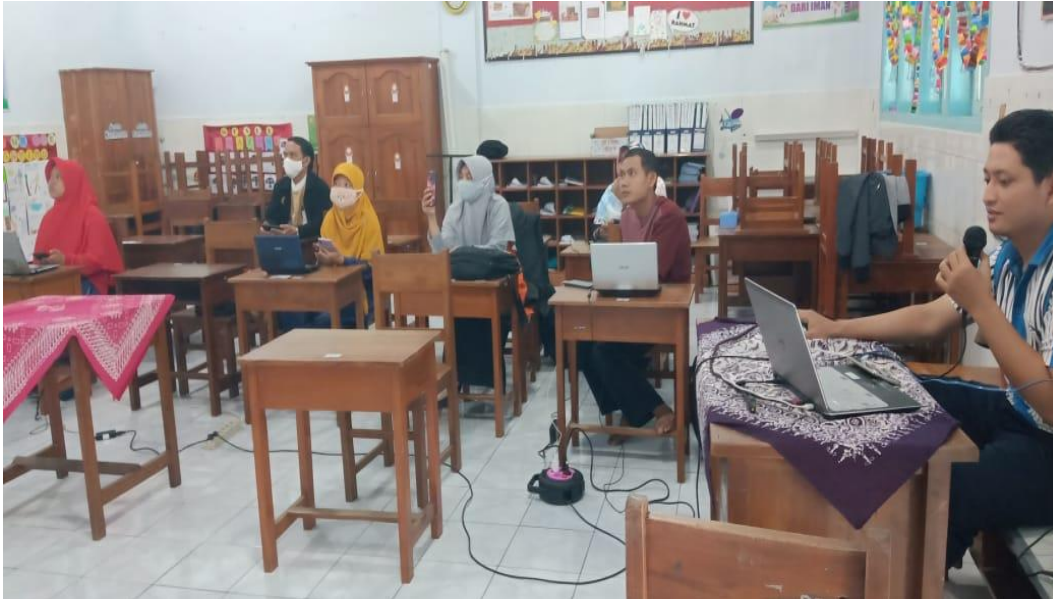
Gambar Evaluasi Guru Pendidikan Agama Islam SD Plus Rahmat Kediri