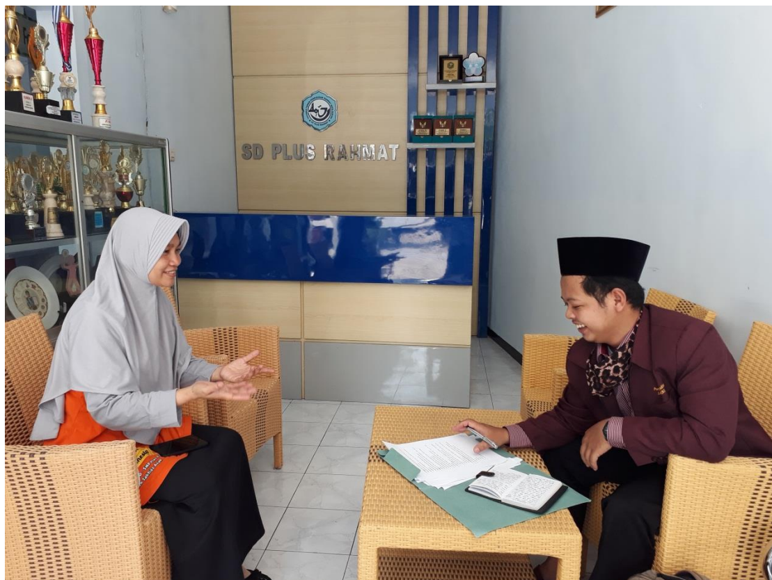
Gambar Wawancara dengan Guru PAI ABK SD Plus Rahmat Kediri