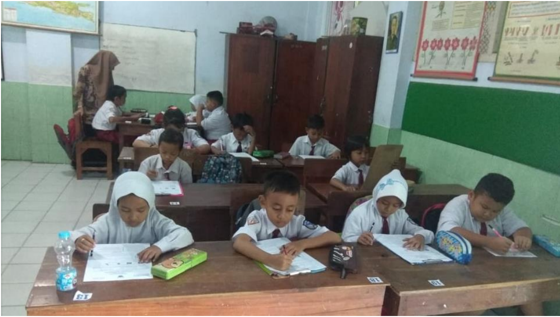
Gambar Evaluasi Pembelajaran SDN Burengan 5