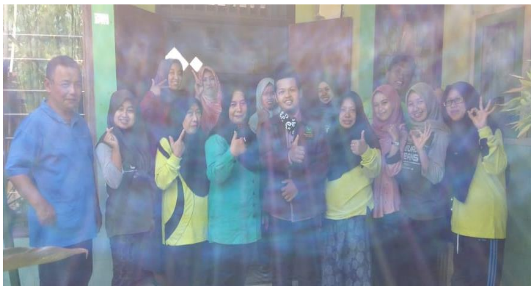
gambar Foto bersama dewan guru SDN Burangan 5 Kediri