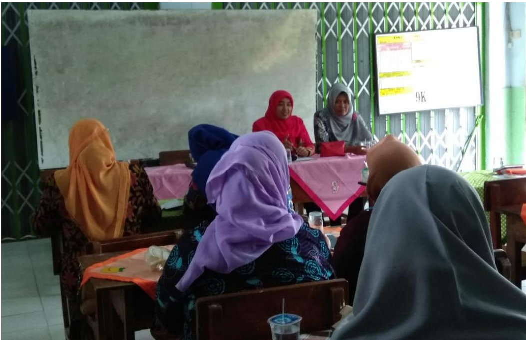
Gambar Evaluasi Guru Mapel dan Wali Kelas SDN Burengan 5