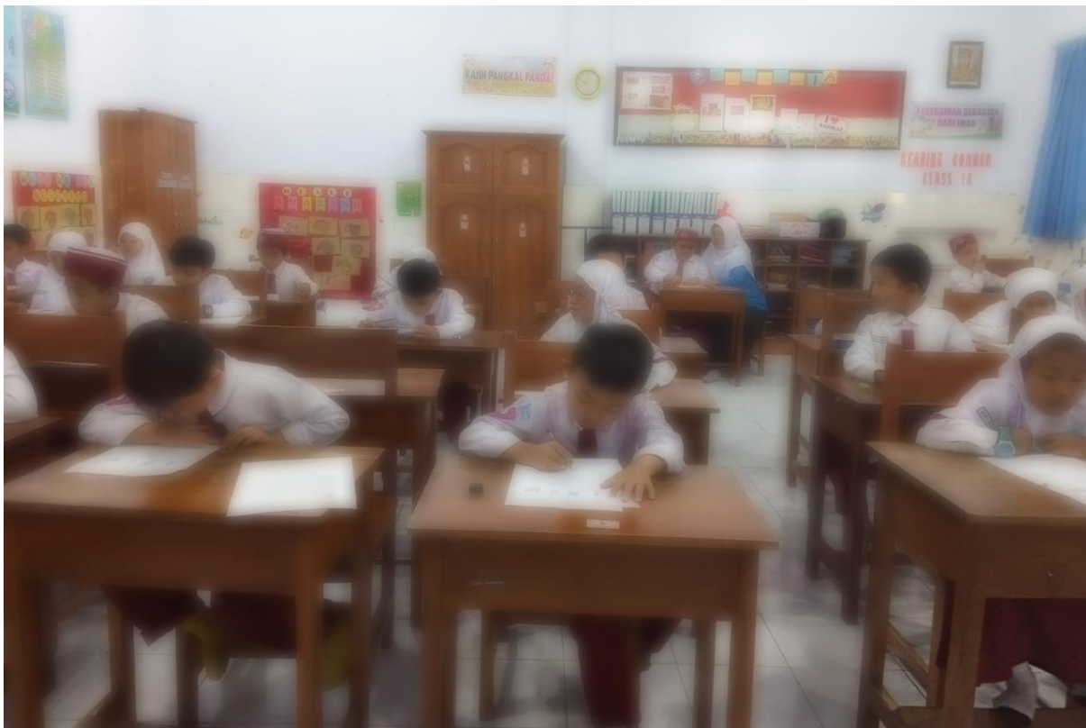
Gambar Evaluasi Pembelajaran SD Plus Rahmat Kediri