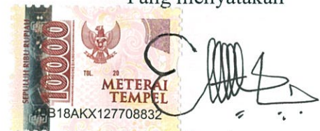
Etik Wulanning Arum