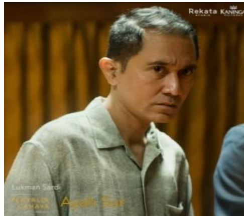
Gambar 2.8 Tokoh Ayah Sur