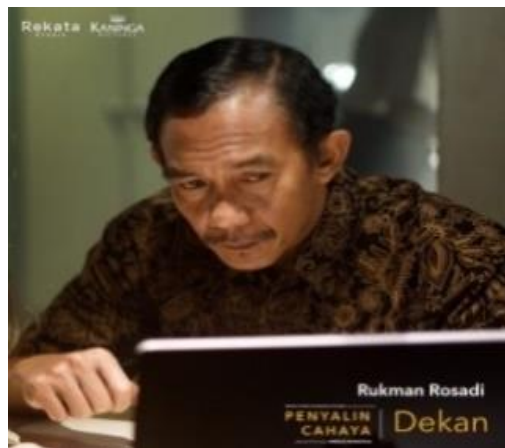
Gambar 2.10 Tokoh Dekan Kampus