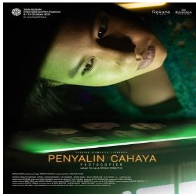
Gambar 2.1 Poster Film Penyalin Cahaya