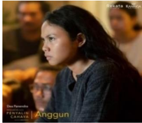
Gambar 2.7 Tokoh Anggun