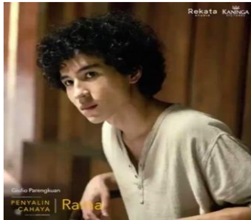
Gambar 2.6 Tokoh Rama