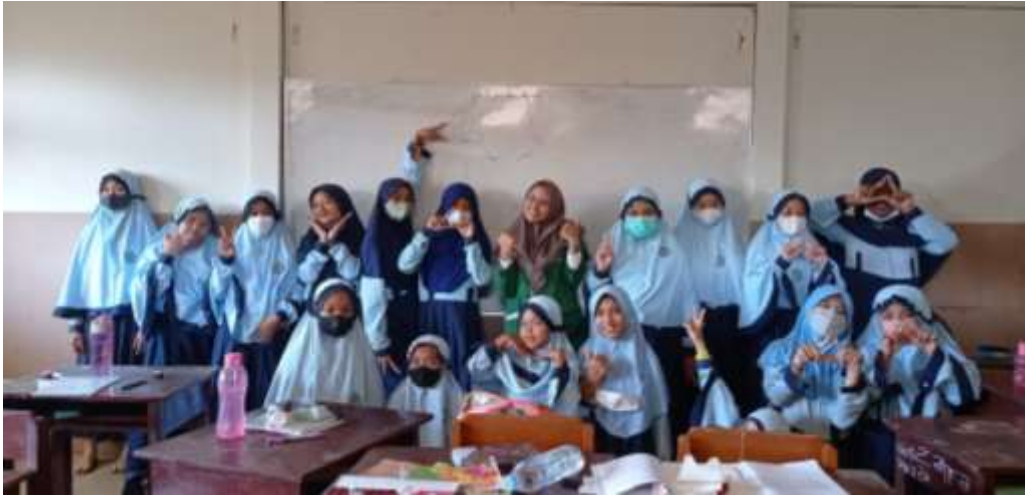
Foto bersama dengan seluruh anggota kelas.