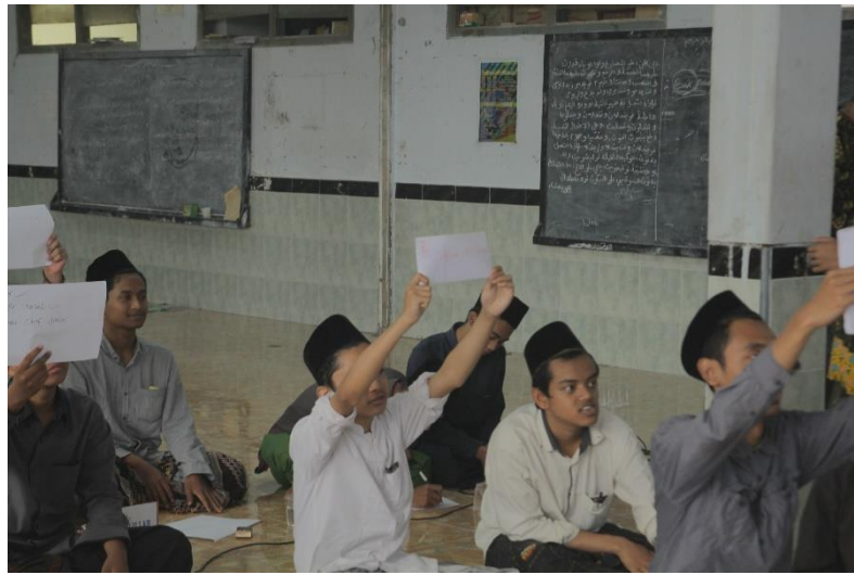
Gambar 4. Kegiatan-Kegiatan Ekstrakurikuler Jam'iyah Ar Rohmah