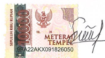
Sisca Puji Lestari