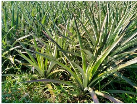
Gambar 3: umur 12 bulan