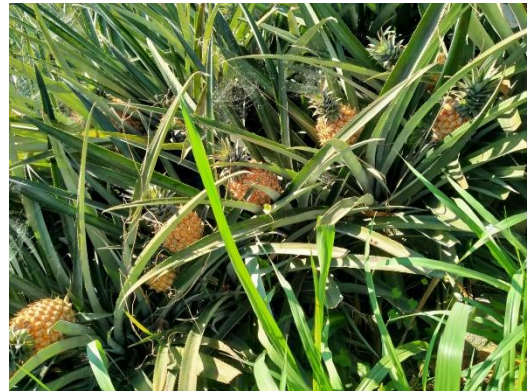
Gambar 6: siap panen