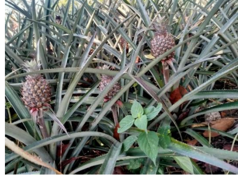
Gambar 4: umur 14 bulan