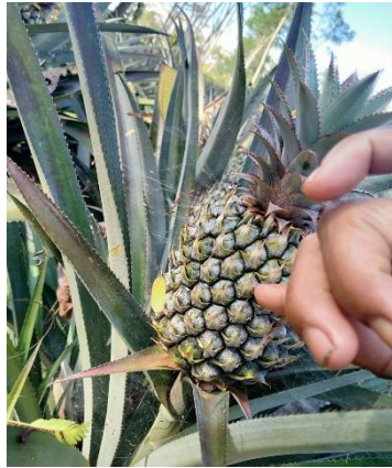
Gambar 5: 16 bulan