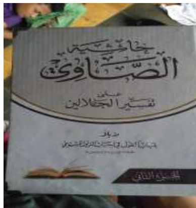
Gambar Sumber Sekunder