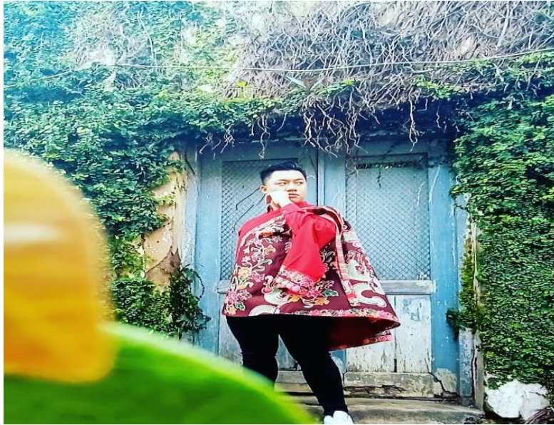
BISNIS JAHIT (ABSHON FASHON)