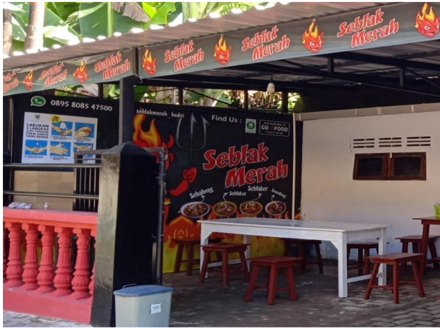
BISNIS SEBLAK DAN BARBERSHOP