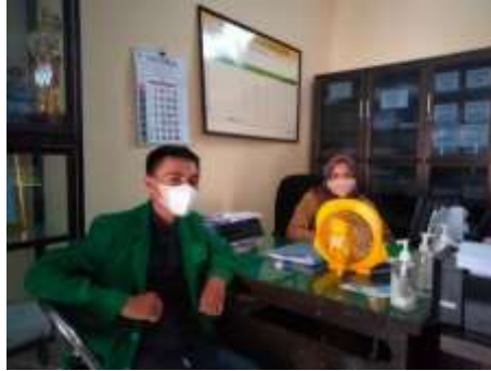
Wawancara bersama perangkat desa