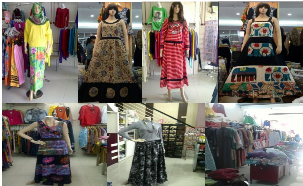
Produk-produk yang dijual oleh Butik Busana Muslim Balqis