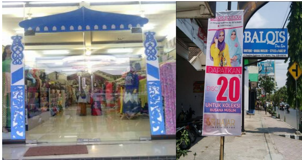
Lokasi Butik Busana Muslim Balqis