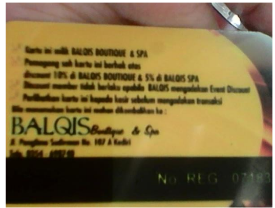
Kartu Member Butik Busana Muslim Balqis