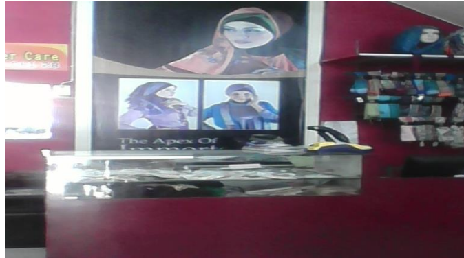
Tempat Pembayaran/Kasir Butik Busana Muslim Balqis