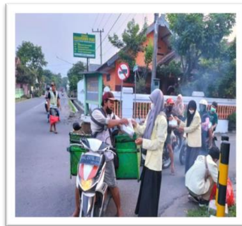
Pembagian Ta'jil Kepada Masyarakat Sekitar Pare