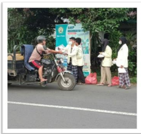
Pembagian Ta'jil Kepada Masyarakat Sekitar Pare