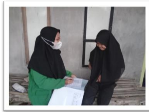
Wawancara dengan Siswa Kelas VII (Adik Lida)