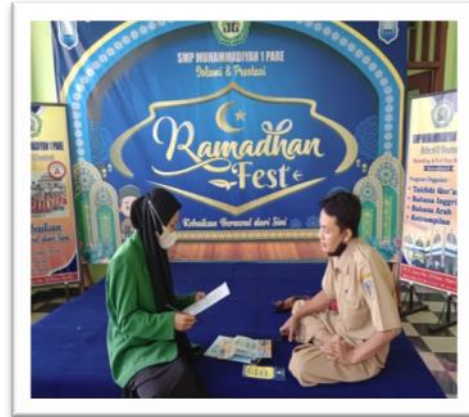
Wawancara dengan Ketua Panitia PPDB