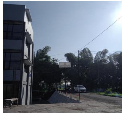
Pondok Pesantren Darul Muslimin Muhammadiyah Pare