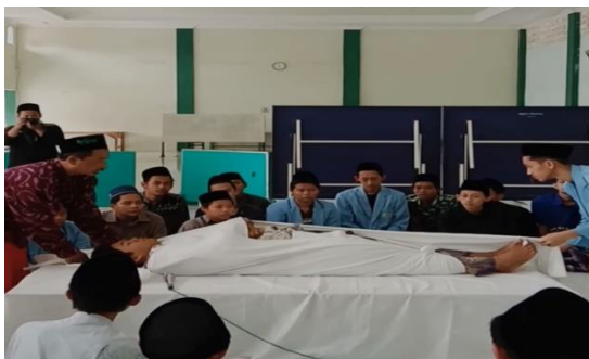
Dokumentasi Kegiatan Pelatihan Pemulasaran Jenazah