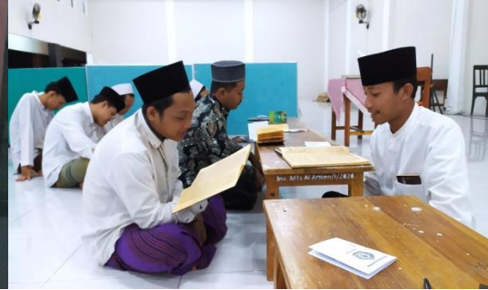
Dokumentasi kegiatan Roisan sebelum asatidz masuk kelas