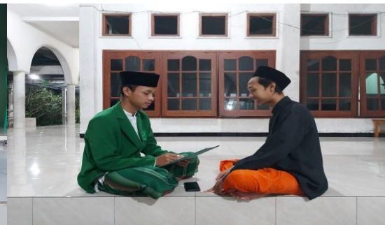
Wawancara dengan Koordinator Divisi SYIAR OSIMA