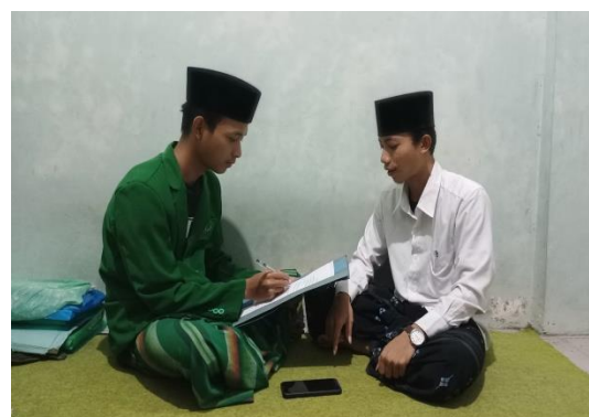
Wawancara dengan santri dari kelas 1 Tsanawi