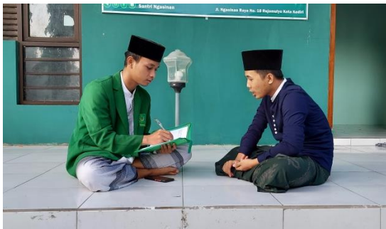
Wawancara dengan Ketua Pengurus OSIMA