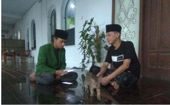
Wawancara dengan Kepala Madrasah Diniyah