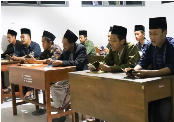
Observasi pra diniyah di kelas 5 ibtida'