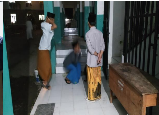
Proses pemberian takziran bagi santri yang terlambat