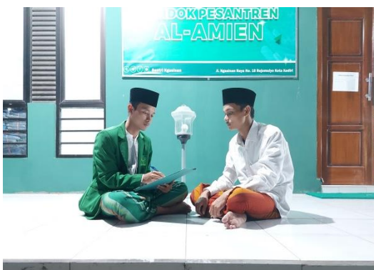
Wawancara dengan Koordinator Divisi Keamanan OSIMA