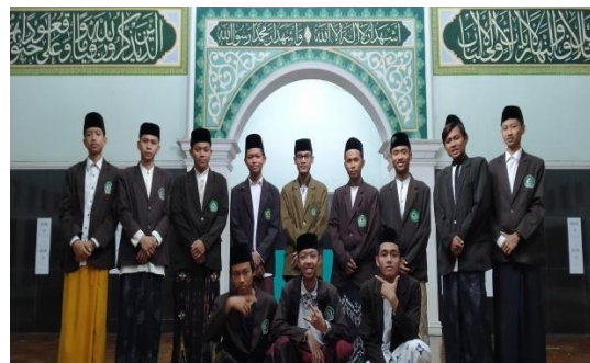
Jajaran Pengurus OSIMA