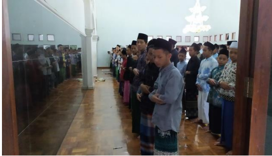
Dokumentasi kegiatan shalat ghaib