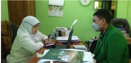
Wawancara dengan Waka Kurikulum