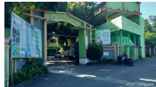
Bangunan Halaman Madrasah