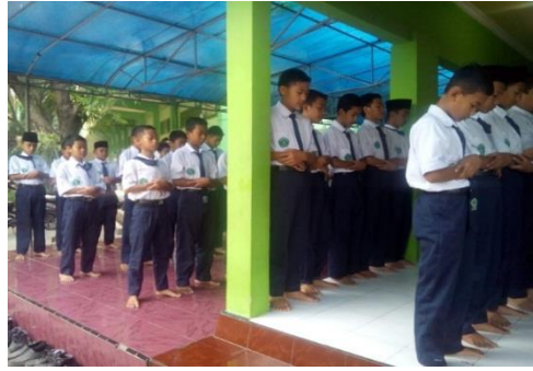
Kegiatan Dhuha Shalat berjama'ah