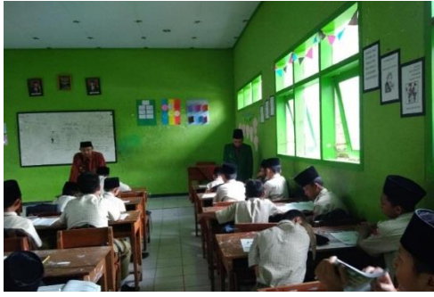
Kegiatan belajar mengajar di kelas