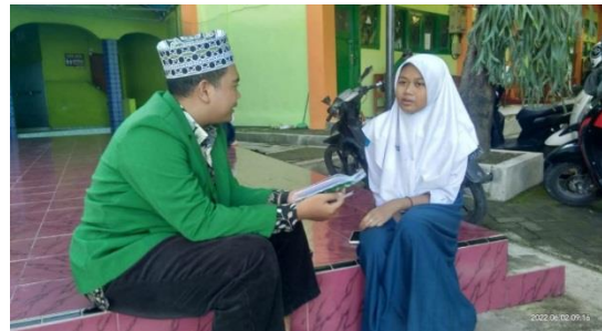
Wawancara dengan Peserta didik