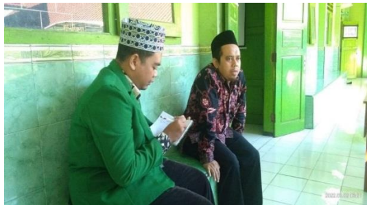
Wawancara dengan Guru Akidah Akhlak