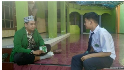
Wawancara dengan Peserta didik