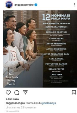
Gambar 3.3 dan 3.4 dok nominasi penghargaan dalam piala IMAA dan PIALA MAYA.