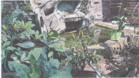
Dokumentasi taman kolam