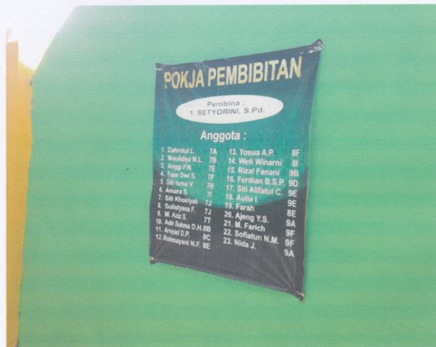
Dokumentasi daftar jadwal pembibitan