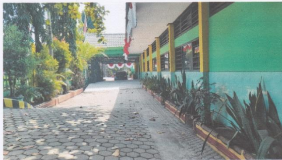
Dokumentasi halaman depan hijau