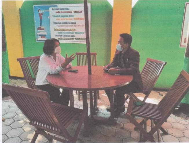
Dokumentasi bersama guru SMP Negeri 1 Mojo