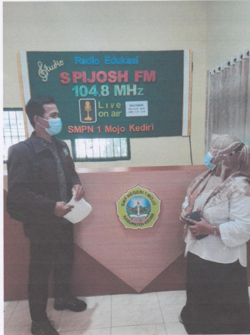
Dokumentasi bersama Tim Adiwiyata SMP Negeri 1 Mojo