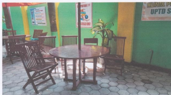
Dokumentasi taman baca