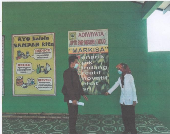
Dokumentasi bersama tim adiwiyata SMP Negeri 1 Mojo