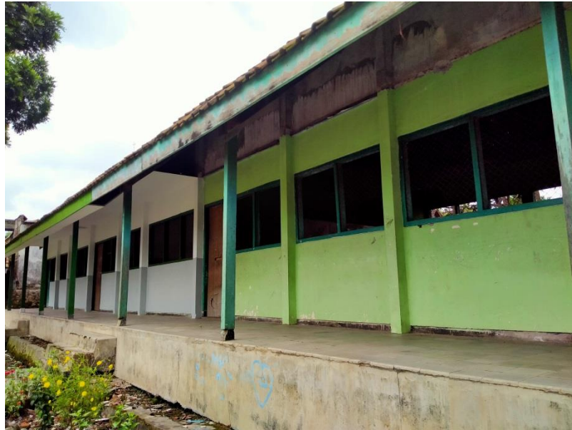
Dokumentasi 3. Kondisi MI Darul Muttaqin