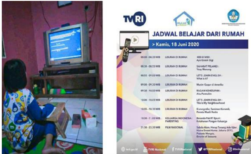
Dokumentasi 1. Kegiatan belajar via tayangan televisi