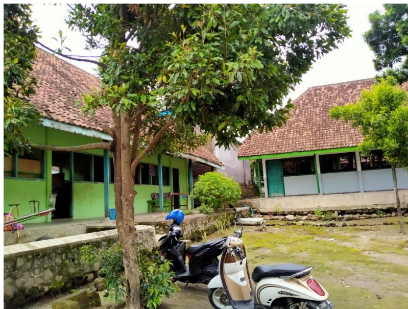
Dokumentasi 2. Kondisi MI Darul Muttaqin