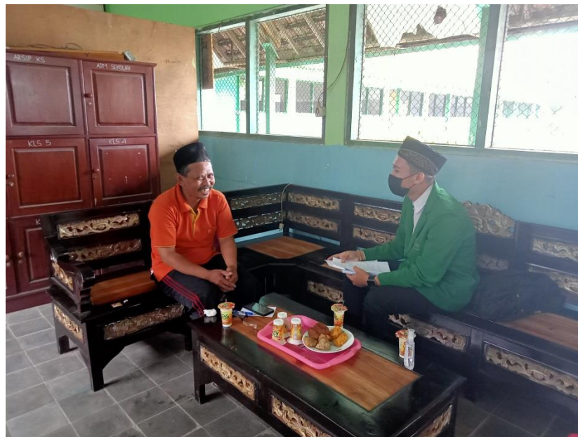
Dokumentasi 6. Wawancara Dengan Narasumber