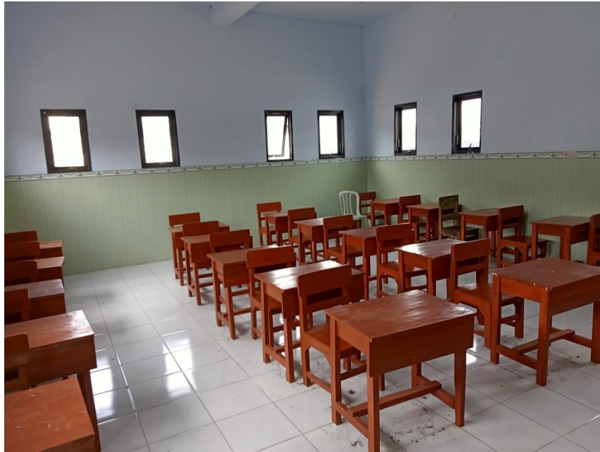
Dokumentasi 5. Kondisi Dalam Kelas MI Darul Muttaqin