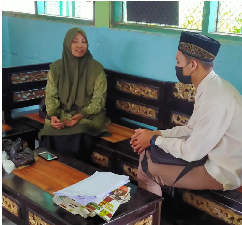
Dokumentasi 8. Wawancara Dengan Narasumber