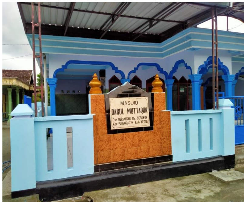
Dokumentasi 4. Masjid MI Darul Muttaqin