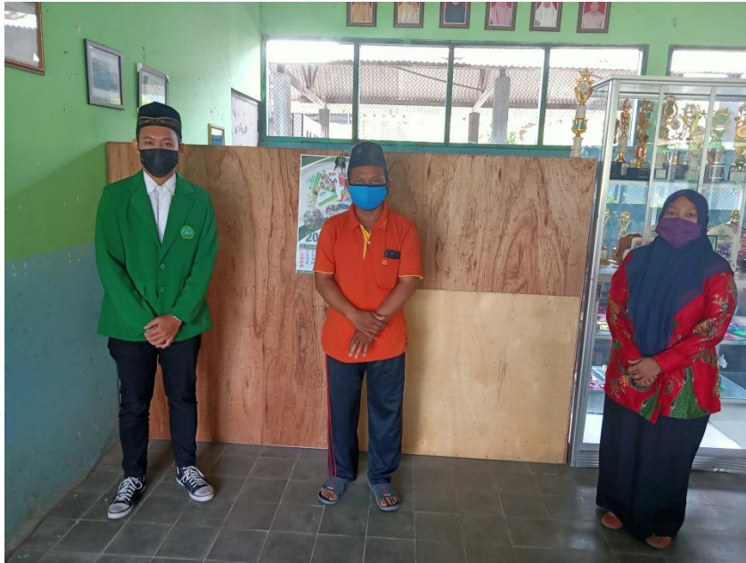
Dokumentasi 7. Wawancara Dengan Narasumber