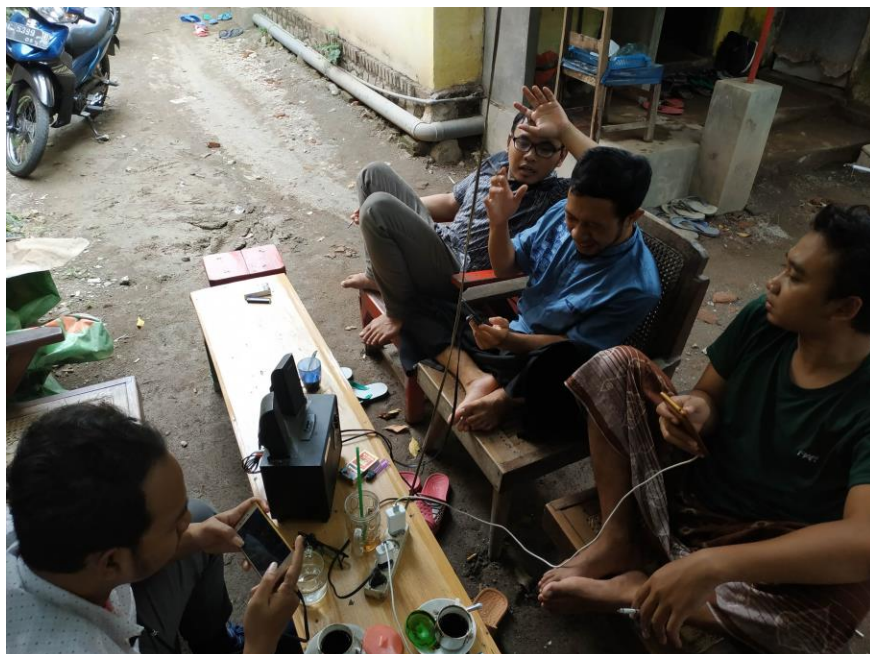
Kegiatan wawancara peneliti di sela waktu kosong santri