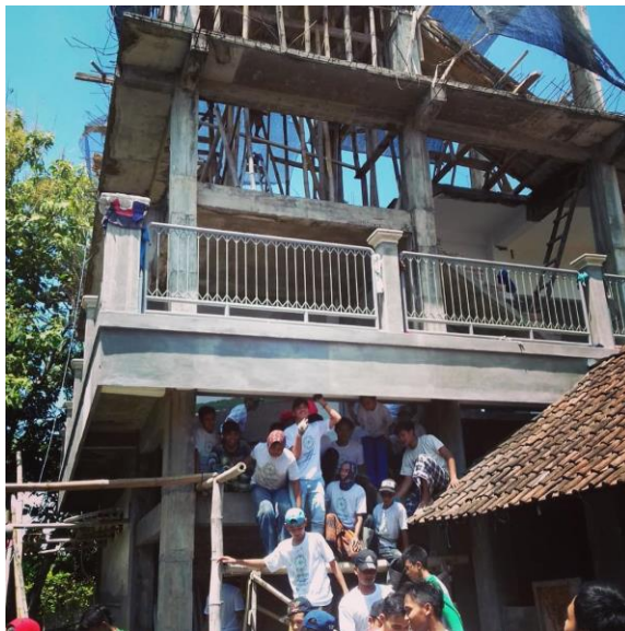
Kegiatan Santri Ro'an / kerja bakti Pembangunan Fasilitas Pondok