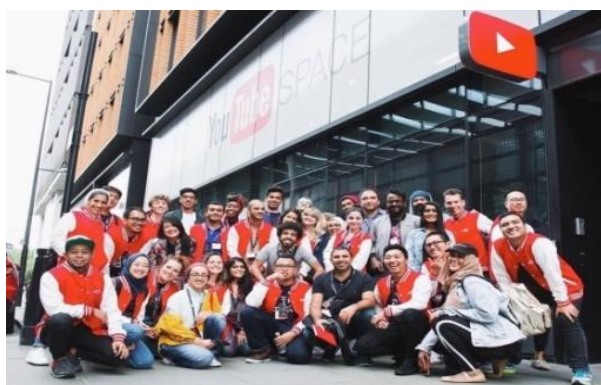
Gambar 2.2 Para Duta Creator for Change dari Berbagai Negara