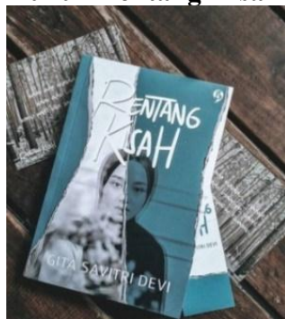
Gambar 2.3 Buku “Rentang Kisah”