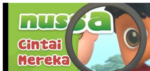
Gambar 2.44 Tampilan judul episode Nussa : Cintai Mereka