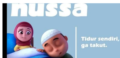
Gambar 2.10 Tampilan judul episode Nussa : Tidur Sendiri Gak Takut!!