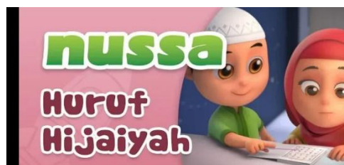
Gambar 2.42 Tampilan judul episode Nussa : Huruf Hijaiyah