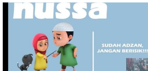
Gambar 2.14 Tampilan judul episode Nussa : Sudah Azan Jangan Berisik