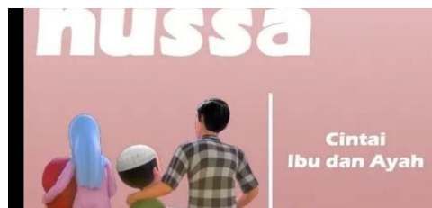
Gambar 2.28 Tampilan judul episode Nussa : Cinta Ibu dan Ayah