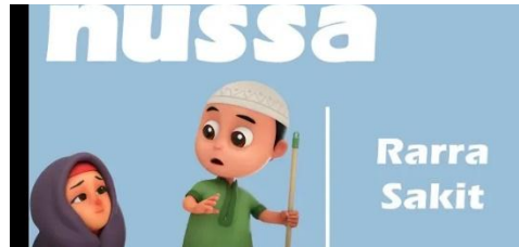
Gambar 2.24 Tampilan judul episode Nussa : Rara Sakit