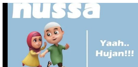
Gambar 2.20 Tampilan judul episode Nussa : Yaahh... Hujan!!