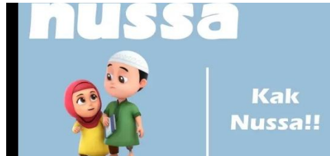
Gambar 2.21 Tampilan judul episode Nussa : Kak Nussa!!!