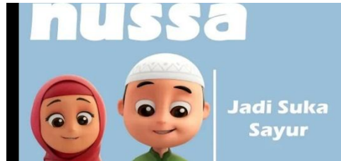
Gambar 2.27 tampilan judul episode Nussa : Jadi Suka Sayur