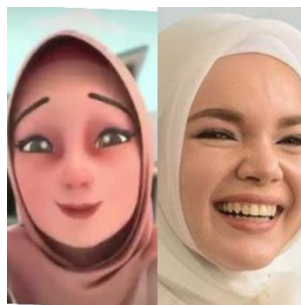
Gambar 2.4 karakter Tante Dewi dan pengisi suaranya

Karakter keempat dalam serial Animasi Nussa dan Rara adalah tante Dewi yang merupakan adik dari Umma yang sedang melaksanakan tugas negara menjadi Pegawai Negri Sipil di pelosok Negri, dengan sifat yang periang dan terkesan seperti anak muda yang memiliki energi terhadap berbagai hal. Penampakan karakter Tante Dewi hanya Sekali saja diperlihatkan pada saat video ke-24 dengan judul Bukan Mahram, dengan wajah yang terkesan mirip dengan artis Dewi Sandra.