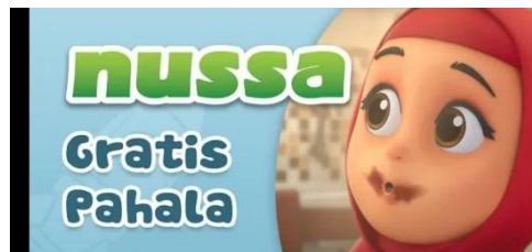
Gambar 2.41 Tampilan judul episode Nussa : Gratis Pahala