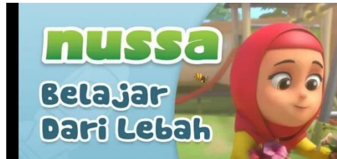
Gambar 2.39 Tampilan judul episode Nussa : Belajar Dari Lebah