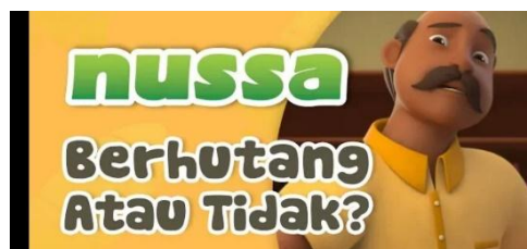
Gambar 2.50 Tampilan judul episode Nussa : Berhutang Atau Tidak?