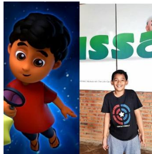
Gambar 2.5 karakter Abdur dan pengisi suaranya

Karakter kelima dalam serial animasi Nussa dan Rara adalah Abdul, yang merupakan teman sepermaiana dari Nussa dan Rara, karakter Abdul sendiri merupakan cerminan dari masyarakat Indonesia Timur yang mana memiliki perawakan kulit coklat gelap dan rambut yang cenderung keriting, Abdul sendiri digambarkan sebagai anak yang kreatif dan enerjik, dan memiliki sifat pemalu seperti pada anak pada umumnya.