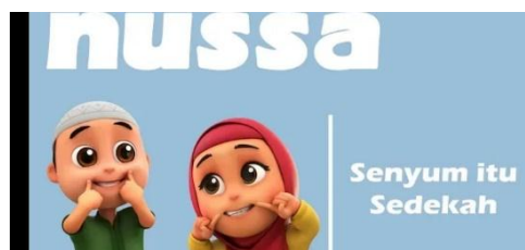
Gambar 1.12 Tampilan judul episode Nussa : Senyum Itu Sedekah