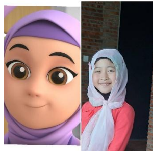
Gambar 2.6 Karakter Syifa dan pengisi suaranya

terlihat dari kulit yang berwarna putih bersih, dalam hal penampilannya selalu mengenakan baju dan kerudung yang berwarna ungu. Dalam hal sifat Syifa terkesan keras dan tegas dalam menghadapi berbagai hal, tetapi juga memiliki sifat peka terhadap lingkungan.