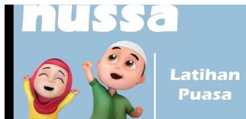
Gambar 2.29 Tampilan judul episode Nussa : Latihan Puasa