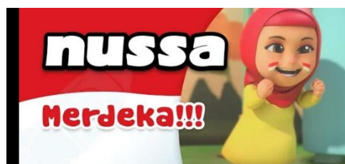
Gambar 2.37 Tampilan judul episode Nussa : MERDEKA!!!