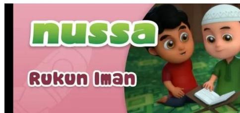
Gambar 2.38 Tampilan judul episode Nussa : Rukun Iman