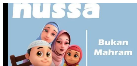
Gambar 2.30 Tampilan judul episode Nussa : Bukan Mahram