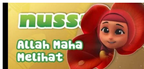
Gambar 2.47 Tampilan judul episode Nussa : Allah Maha Melihat