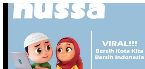
Gambar 2.13 Tampilan judul episode Nussa : Viral!!! Bersih Kota Bersi Indonesia