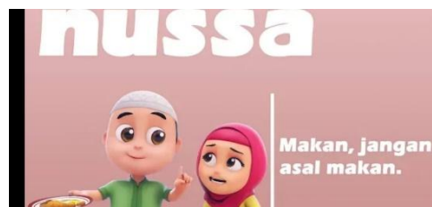
Gambar 2.11 Tampilan judul episode Nussa : Makan Jangan Asal Makan