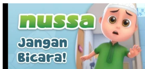
Gambar 2.40 Tampilan judul episode Nussa : Jangan Bicara