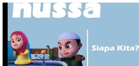
Gambar 2.17 Tampilan judul episode Nussa : Siapa Kita