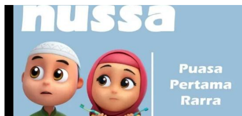
Gambar 2.31 Tampilan judul episode Nussa : Puasa Pertama Rara