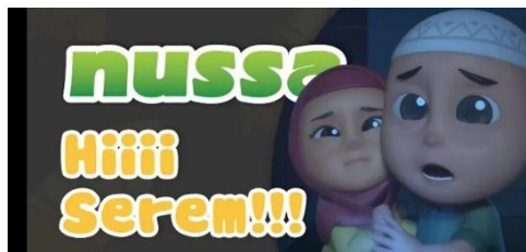
Gambar 2.48 Tampilan judul episode Nussa : Hiiii. Serem!!!