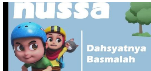
Gambar 1.11 Tampilan judul episode Nussa : Dasyatnya Basmalah