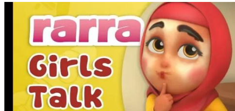
Gambar 2.43 Tampilan judul episode Nussa : Girl Talk