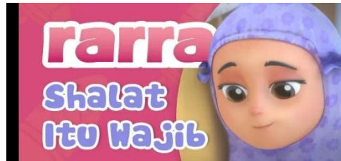
Gambar 2.49 Tampilan judul episode Nussa : Sholat Itu Wajib