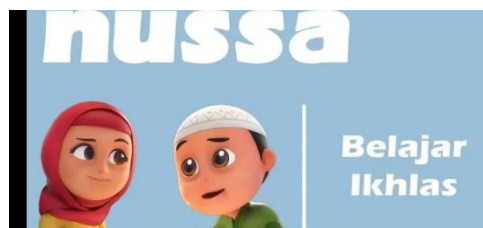
Gambar 2.16 Tampilan judul episode Nussa : Belajar Ikhlas