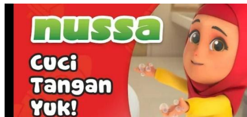
Gambar 2.45 Tampilan judul episode Nussa : Cuci Tangan Yukk