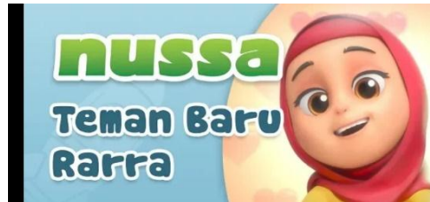
Gambar 2.36 Tampilan judul episode Nussa : Teman Baru Rara