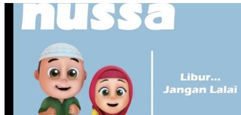
Gambar 2.26 Tampilan judul episode Nussa : Libur Jangan Lalai