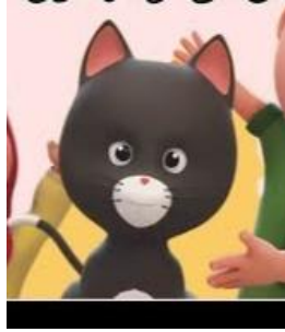
Gambar 2.8 karakter Antta