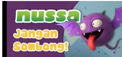
Gambar 2.46 Tampilan judul episode Nussa : Jangan Sombong