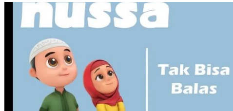
Gambar 2.23 Tampilan judul episode Nussa : Gak Bisa Balas