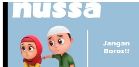
Gambar 2.18 Tampilan judul episode Nussa : Jangan Boros