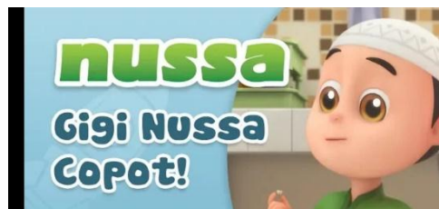
Gambar 2.35 Tampilan judul episode Nussa : Gigi Nussa Copot