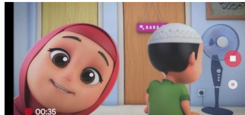
Gambar 2.9 Tampilan Judul episode Nussa : Teaser Trailer