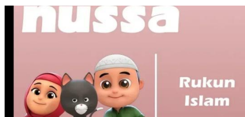
Gambar 2.25 Tampilan judul episode Nussa : Rukun Islam