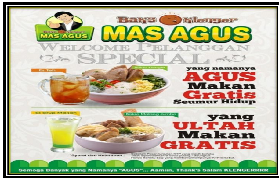
Salah satu iklan Bakso Klenger Mas Agus Kota Kediri