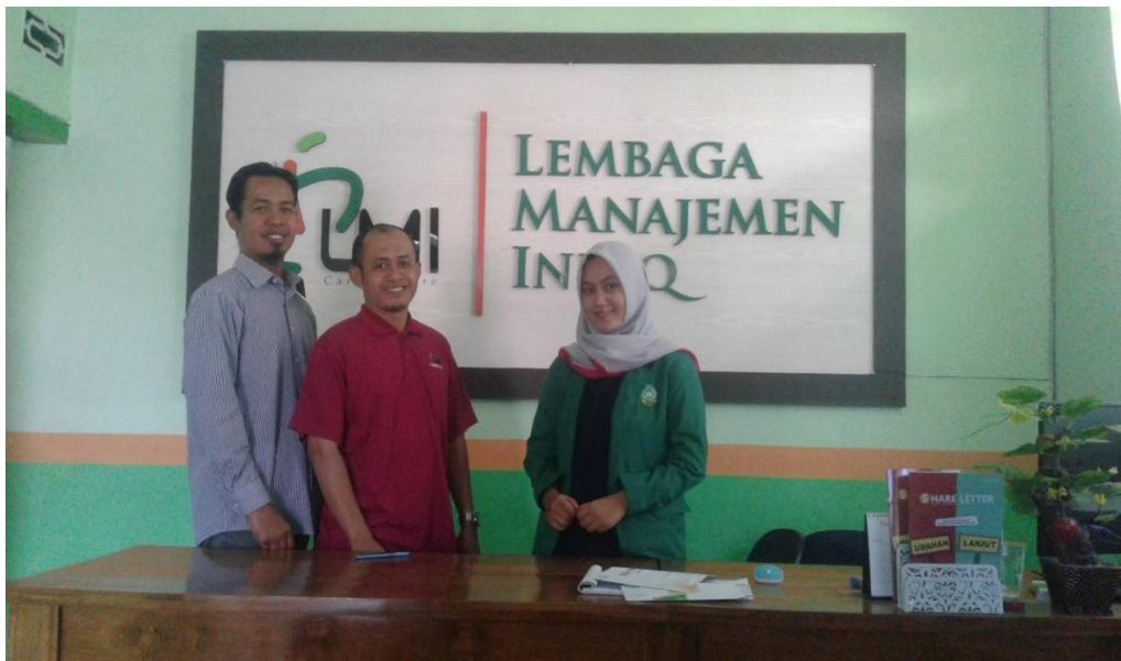
Keterangan: bersama dengan kabag strategis Area I dan PPZ