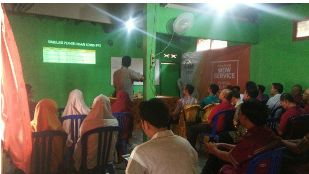
Keterangan: sosialisasi dan pelatihan PPZ