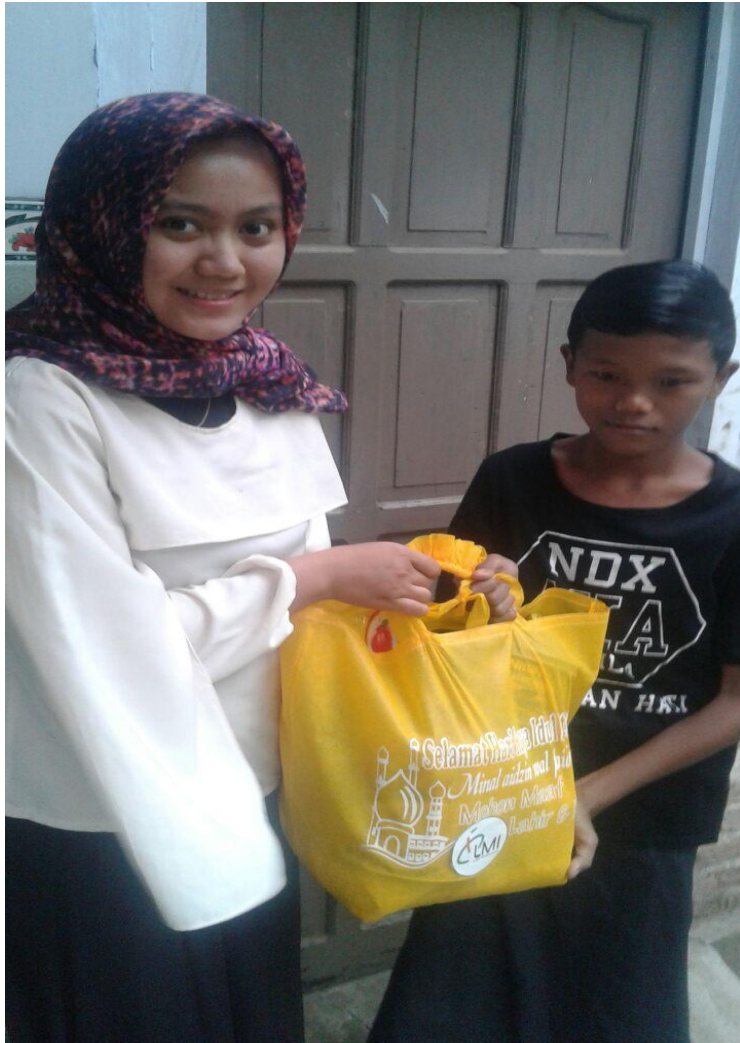
Keterangan: penyaluran bingkisan lebaran kepada anak yatim