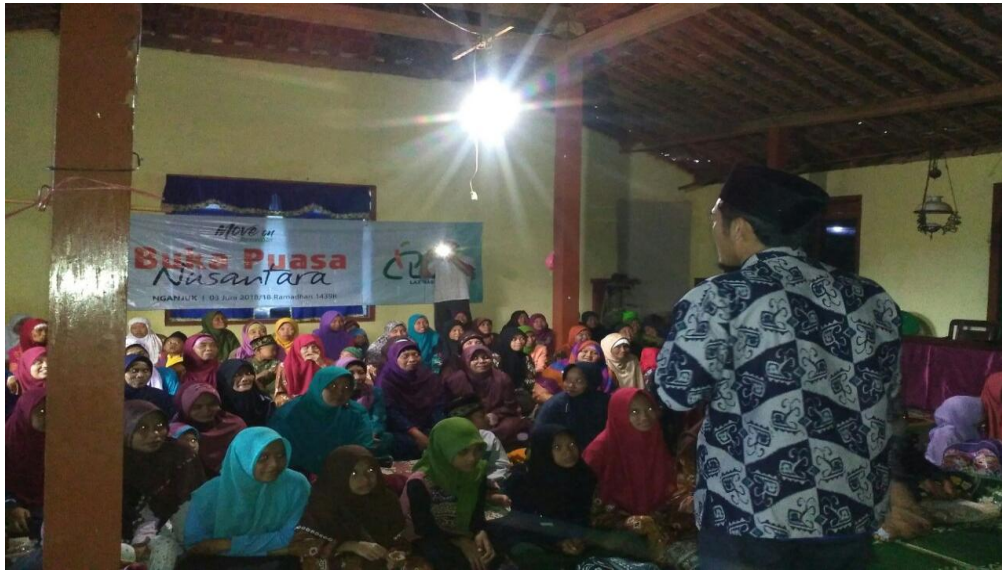
Keterangan: mengadakan buka bersama dengan yatim dan dhuafa di Dsn. Ngroto Ds. Margopatut. Kec sawahan. Kab Nganjuk