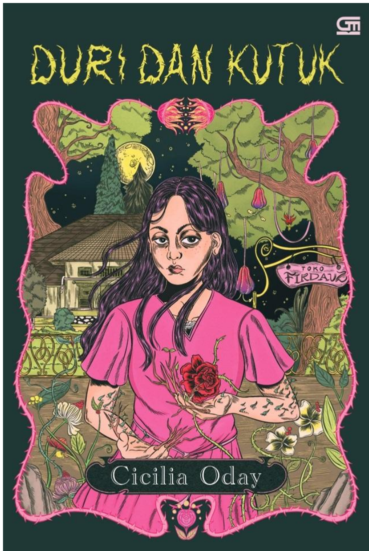
LAMPIRAN 3 Sampul novel Duri dan Kutuk karya Cicilia Oday