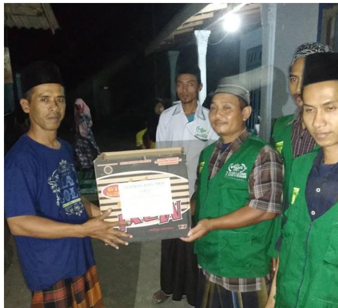
Foto Dokumentasi Gerakan Koin Amal pada Kegiatan Keagamaan