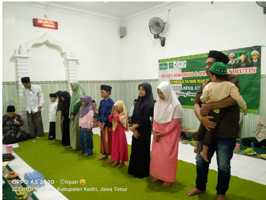
Foto Dokumentasi Santunan Anak Yatim