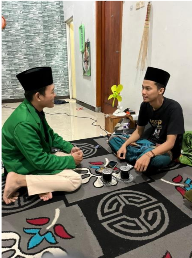
Foto Dokumentasi Wawancara dengan Salah Satu Donatur UPZISNU Desa Turus