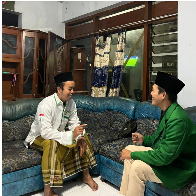
Foto Dokumentasi Wawancara dengan Sekretaris UPZISNU Desa Turus