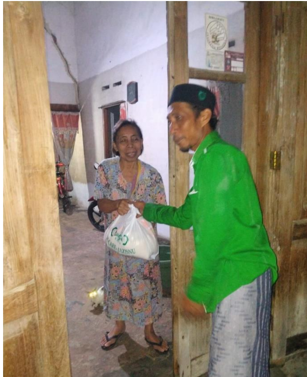
Foto Dokumentasi Penyaluran Zakat kepada Dhuafa