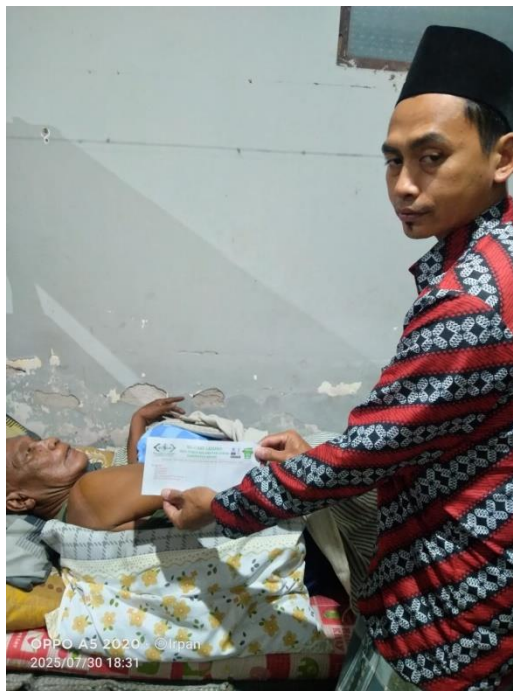
Foto Dokumentasi Penyaluran ZIS kepada Pasien Sakit