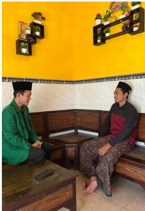
Foto Dokumentasi Wawancara dengan Salah Satu Donatur UPZISNU Desa Turus