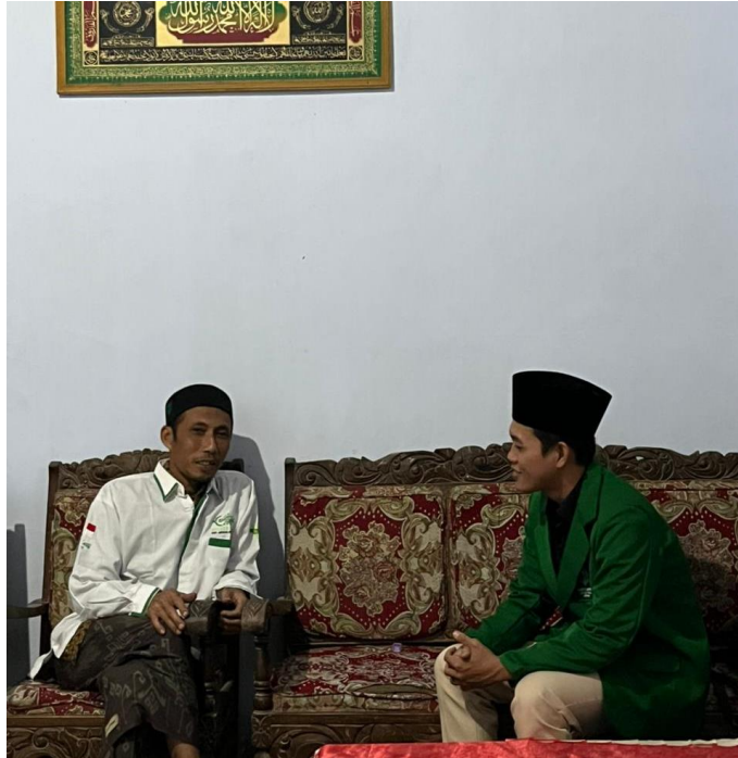
Foto Dokumentasi Wawancara dengan Ketua UPZISNU Desa Turus