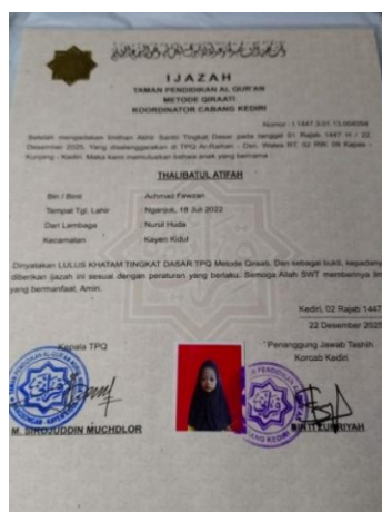
Gambar 4.6 Ijazah Santri 105

Setelah santri dinyatakan lulus imtas dan mengikuti hafiah, pembinaan kemampuan membaca dan menghafal Al-Qur'an dilanjutkan melalui program Pra-PTPT (Pra-Pasca TPQ Program Tahfiz) dan PTPT (Pasca TPQ Program Tahfiz). Dalam pelaksanaan program Pra-PTPT dan PTPT juga dilakukan pemantauan terhadap perkembangan kemampuan santri. Hal tersebut disampaikan oleh Kepala TPQ, Ustaz Sirojuddin sebagai berikut: