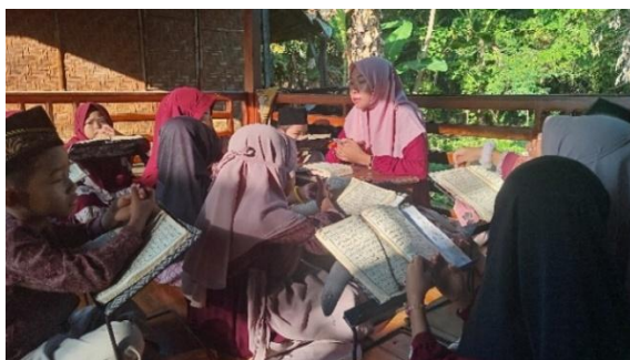
Gambar 4.3 Membaca Al-Qur`an 87

Selanjutnya, santri membaca gharib secara bersama-sama dan menyetorkan hafalan bacaan gharib secara individual. Setelah itu, santri membaca tajwid secara bersama-sama dan menyetorkan hafalan tajwid secara individual. Dalam proses tersebut, ustazah memberikan koreksi secara langsung apabila terdapat kesalahan bacaan maupun penyebutan hukum