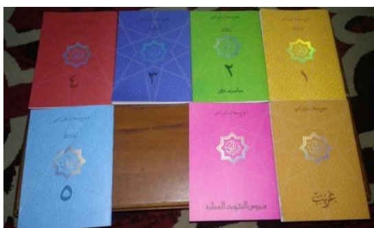
Gambar 4.4 Buku Penunjang 91

Setelah menyelesaikan pembelajaran pada kelas PI dan dinyatakan lulus imtas (imtahan tahap akhir santri) serta mengikuti hafiah, santri melanjutkan pembelajaran pada program Pra-PTPT (Pra-Pasca TPQ Program Tahfiz) dan PTPT (Pasca TPQ Program Tahfiz) sebagai program lanjutan di