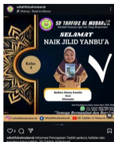
Gambar 4. 5 Tashih Dan Naik Jilid Yanbu'a Di Akun Instagram @Sdtahfidzalmubarak

tashih dan tasmī' secara live yang telah diunggah pada akun sosial media SD Tahfidz Al-Mubarak.