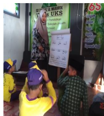
Gambar 4. 4 Guru Memberikan Contoh Pengucapan Dengan Alat Peraga dan Diikuti Siswa

Berdasarkan hasil observasi metode atau langkah-langkah yang diterapkan dalam program tahfidz dengan metode Yanbu’a di SD Tahfidz Al-Mubarak yaitu diawali dengan berdo’a, kemudian guru menyiapkan buku atau alat peraga klasikal sesuai jilid Yanbu’a yang diampu, guru memberikan contoh pengucapan kata perkata dalam alat peraga dan diikuti oleh siswa, anak-anak diminta untuk laluran bersama-sama surat-surat di juz