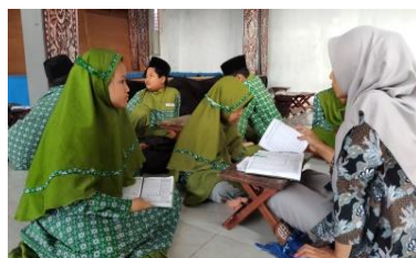
Gambar 4. 1 Siswa Setoran Hafalan Al-Qur'an (Tahfidz)