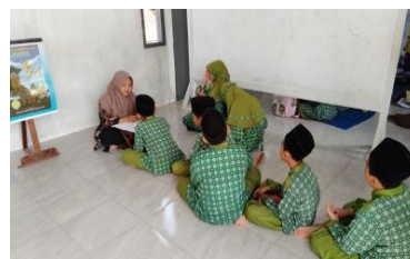
Gambar 4. 2 Siswa Setoran Membaca Al-Qur'an (Binnadzor)

Hasil wawancara dengan Bu Rahma juga menambahkan yang menyatakan bahwa “Langkah-langkah melaksanakan metode Yanbu’anya yang pertama klasikal, terus anaknya setoran.” 167 Hasil wawancara dengan Bu Beti turut menambahkan bahwa “Iya, buku pendukungnya Yanbu’a klasikal, terus juz ‘amma. Buku klasikal itu ada di setiap kelas nanti dibacakan gurunya nanti anaknya menirukan.” 168