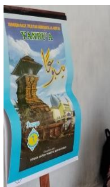
Gambar 4. 3 Buku/Alat Peraga Yanbu’a Klasikal Jilid 6

Hasil wawancara dengan Bu Rahma juga menambahkan yang menyatakan bahwa “Langkah-langkah melaksanakan metode Yanbu’anya yang pertama klasikal, terus anaknya setoran.” 167 Hasil wawancara dengan Bu Beti turut menambahkan bahwa “Iya, buku pendukungnya Yanbu’a klasikal, terus juz ‘amma. Buku klasikal itu ada di setiap kelas nanti dibacakan gurunya nanti anaknya menirukan.” 168