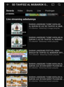
Gambar 4. 6 Tasmī' Di Akun Youtube @Sdtahfidzalmubarakofficial2567

Selain itu, berdasarkan hasil observasi untuk evaluasi siswa itu sendiri oleh guru pembimbing kelas tahfidz dan Yanbu'a di SD Tahfidz Al-Mubarak dilakukan dengan cara guru memberikan catatan kepada setiap siswa pada buku prestasi santri/siswa baik catatan untuk setoran membaca al-Qur'an (binnadzor) maupun setoran hafalan al-Qur'an (tahfidz). 173