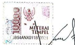
Mochammad Ainur Vikry Izazzarul 22301025

Kediri, 10 Juni 2026 Yang membuat pernyataan