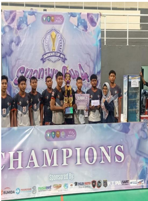
Juara 2 SMANIWA CUP 4