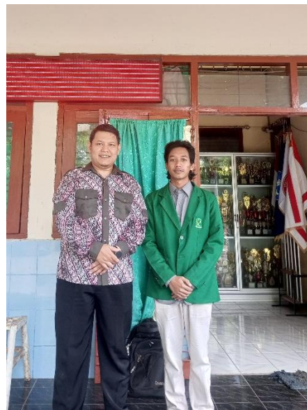
Wawancara dengan Waka Kesiswaan