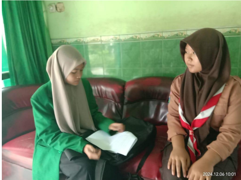
Dokumentasi wawancara bersama siswa