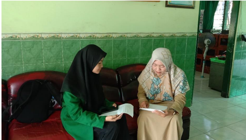
Dokumentasi wawancara Bersama waka kurikulum