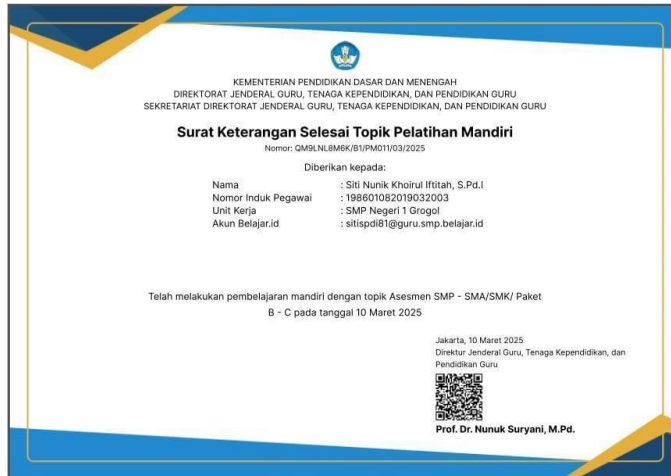
surat keterangan selesai topik di pelatihan mandiri