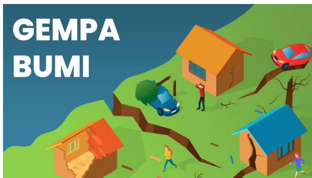
Gambar 2.3 Gempa Bumi