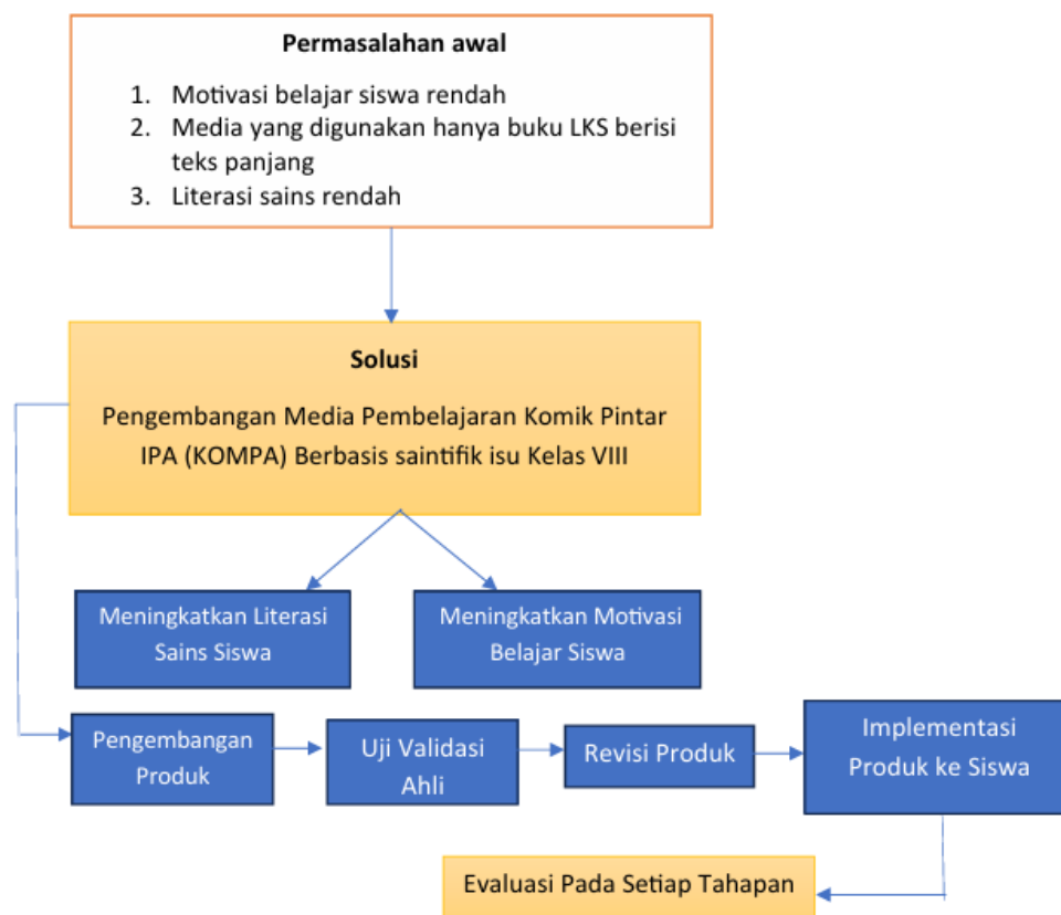
Gambar 2.6 Kerangka Berpikir

Berdasarkan hasil dari observasi awal di ketahui bahwa siswa kelas VIII-6 di SMPN 1 Prambon memiliki kondisi literasi sains dan motivasi belajar yang cukup rendah dikarenakan dalam media pembelajaran konvensional kurang menarik dan kurang sesuai dengan gaya belajar siswa yang dominan ke arah visual. Media KOMPA berbasis saintifik isu di kembangkan sebagai solusi untuk permasalahan tersebut. Di harapkan media pembelajaran KOMPA ini dapat meningkatkan literasi sains dan motivasi belajar siswa, yang akan di buktikan dengan indikator motivasi belajar dan literasi sains juga menggunakan instrumen literasi sains dan motivasi belajar.