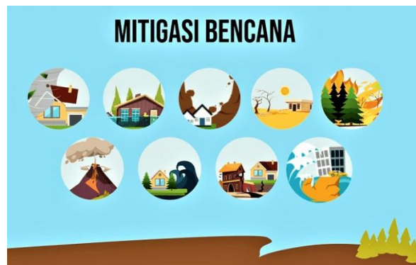
Gambar 2.5 Mitigasi Bencana