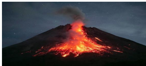
Gambar 2. 4 Gunung Berapi