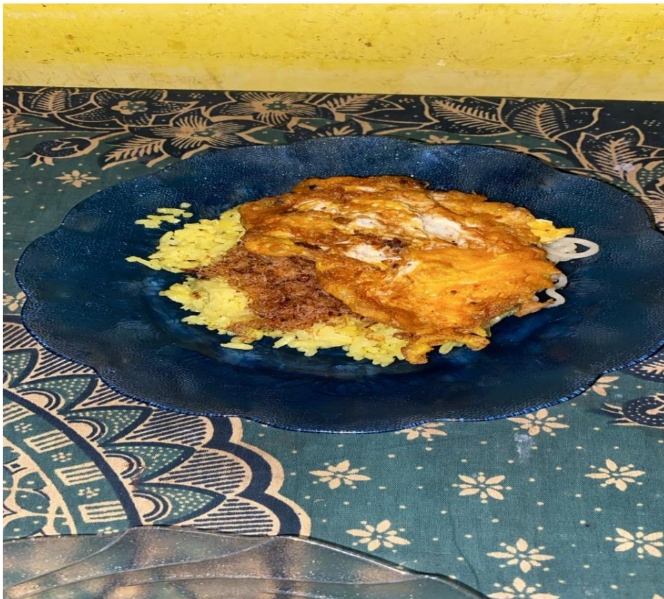
Salah satu contoh bentuk Pancen