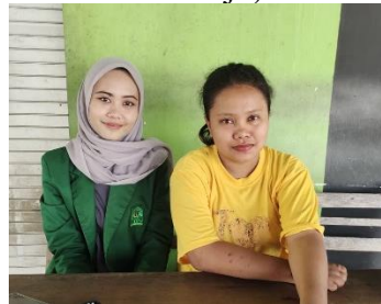
Wawancara dengan Novel Jemaat GKJW Sidorejo