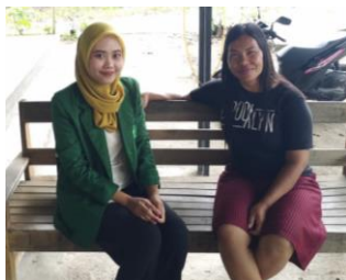
Wawancara dengan Deti Jemaat GKJW Sidorejo