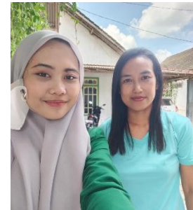
Wawancara dengan Maya Jemaat GKJW Sidorejo