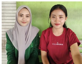
Wawancara dengan Ani Jemaat GKJW Sidorejo