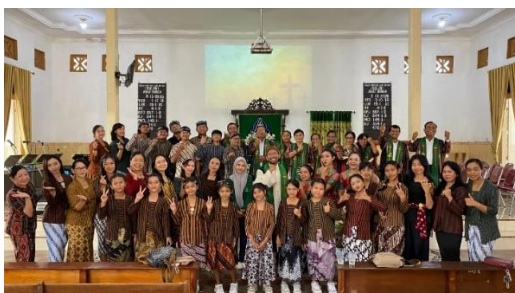
Observasi di GKJW Jemaat Sidorejo