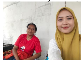
Wawancara dengan Nanik Masyarakat Islam