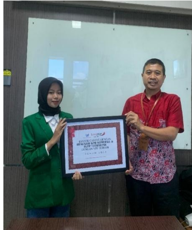
Gambar 2 : Wawancara dengan Account Officer BPD Jatim Syariah Kantor Cabang Kediri