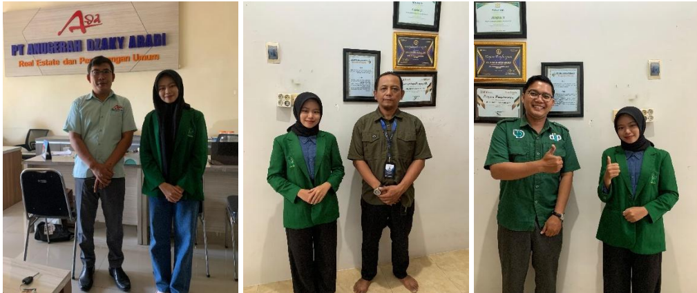
Gambar 4 : Wawancara dengan Nasabah Pembiayaan KPR iB Sejahtera