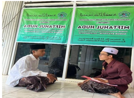
Wawancara dengan Ketua Keamanan