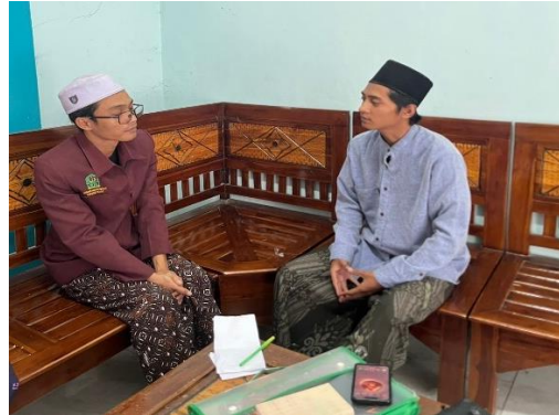
Wawancara dengan Kepala Pesantren