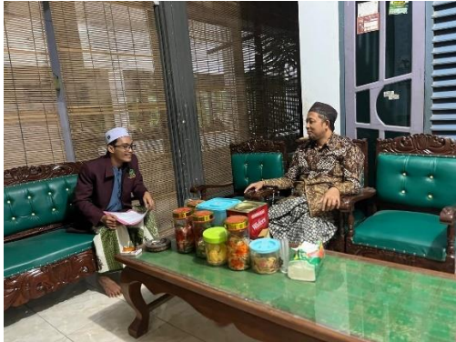
Permohonan Izin Penelitian Dengan Pemasuh