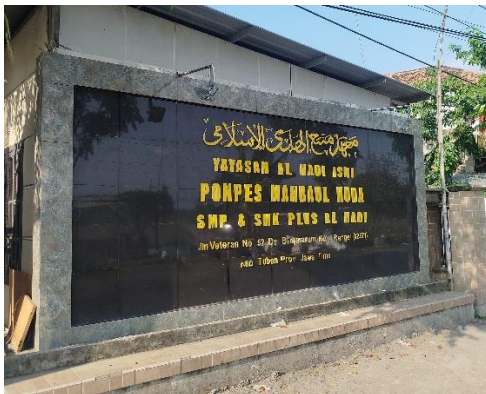
Papan Nama Pondok Pesantren Manbaul Huda