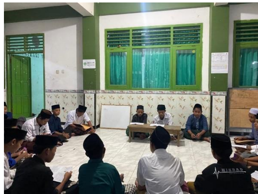
Kegiatan Mutholaah santri