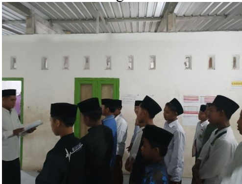
Evaluasi Mingguan Ketertiban Santri