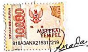
Denada Catur Puri Anggraini