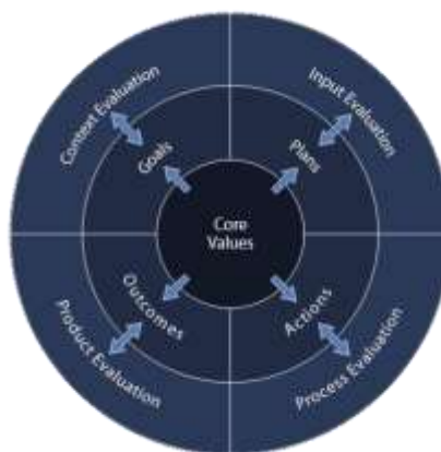
Gambar 2. 2 Komponen Evaluasi Model CIPP

Komponen-komponen dalam CIPP yang dikembangkan oleh Stufflebeam memiliki empat aspek utama sesuai dengan yang ditampilkan dalam gambar berikut.