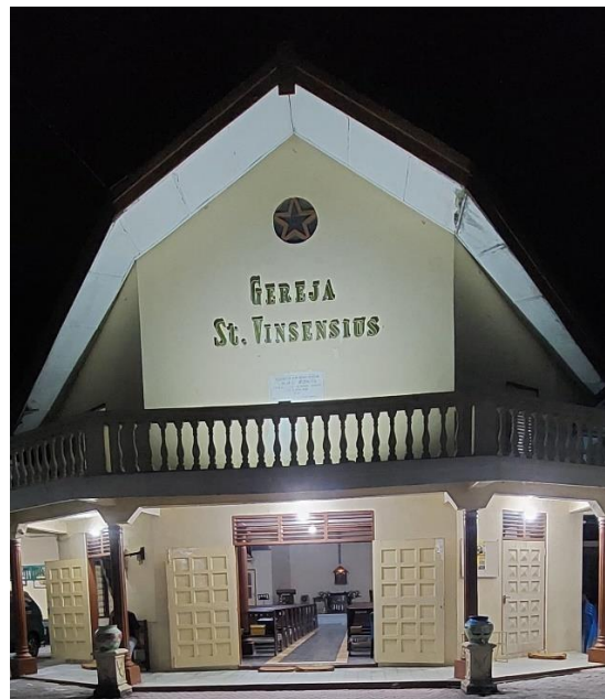
Gereja St. Vinsensius Bandungan