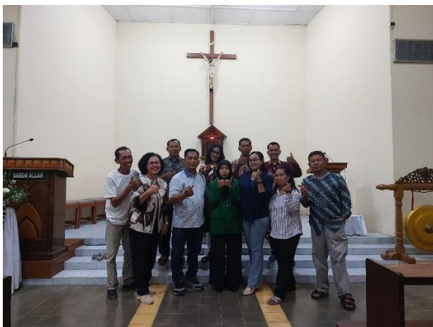
Foto setelah do'a bersama & wawancara dengan warga Katolik