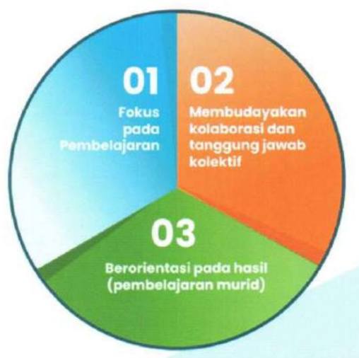
Gambar. 2.1 Tiga Ide Besar komunitas belajar yang Berpusat Pada Murid

Komunitas belajar menempatkan fokusnya pada pembelajaran murid, membudayakan kolaborasi dan tanggung jawab kolektif, serta berorientasi pada data hasil belajar murid. Ketiga fokus ini merupakan tiga ide besar dalam menjalankan komunitas belajar, 24 seperti pada gambar 2.1