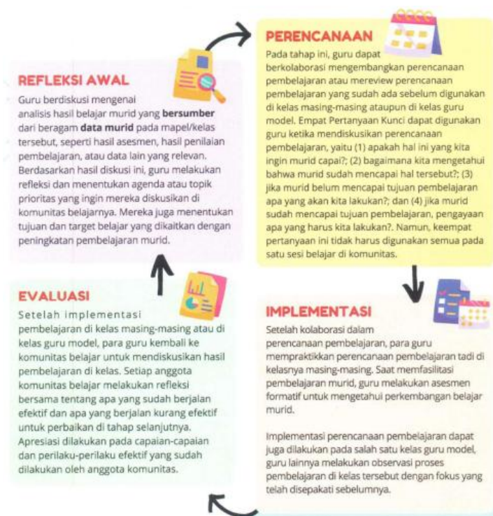
Gambar 2.3 Siklus Komunitas Belajar dalam Sekolah

Adapun siklus digunakan pada Komunitas belajar dalam sekolah dijelaskan dalam Gambar 2.3.