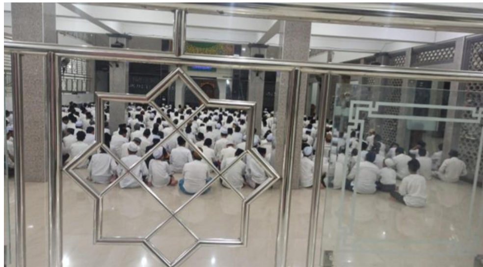
Gambar 5. Suasana sehabis sholat magrib kepala pondok melihat banyak shaf yang kosong karena beberapa santri tidak jamaah dan telat lantas memberi nasehat wejangan kepada santri untuk tepat waktu.

Biasanya kan ngobrol langsung atau pas habis kena pelanggaran, terus dia diselingi nilai-nilai harus kedisiplinan dan kejujuran. Biasanya lebih masuk ke hatinya, karena langsung face-to-face atau pas sambil apa itu... menurut saya lebih masuk ke dia daripada yang kita harus buat kelas khusus, pertemuan khusus yang membahas materi tentang kedisiplinan dan kejujuran. Ngantuk biasanya. 111