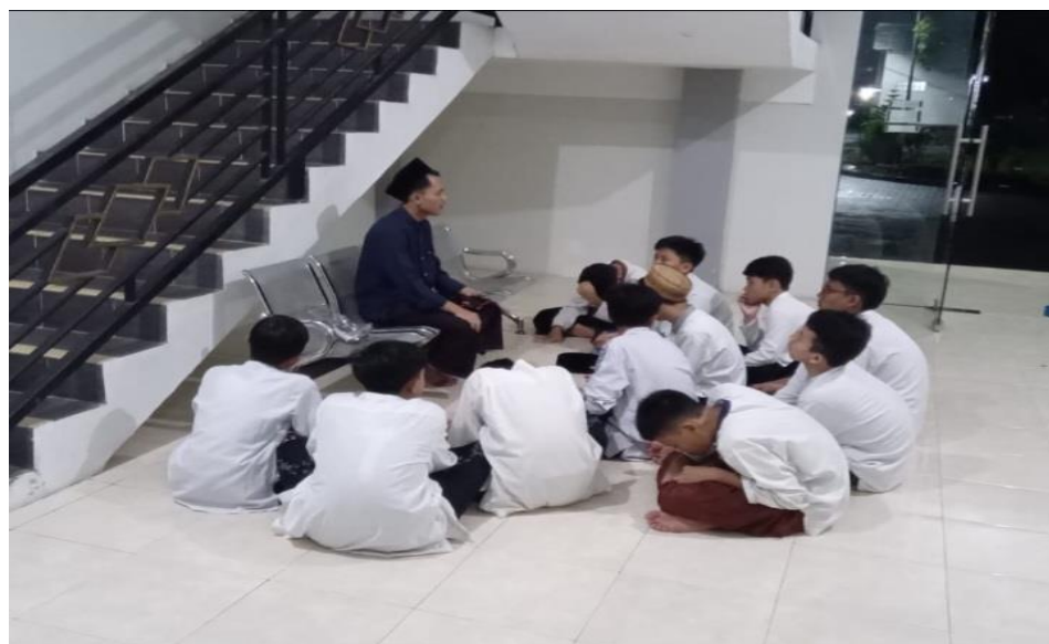
Gambar 3. Suasana Beberapa Santri diberi wejangan dalam bentuk nasehat dan teguran oleh pengurus pondok karena ketahuan melanggar telat datang sholat jamaah.