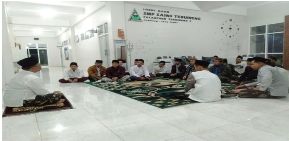
Gambar 6. Suasana Rapat Bulanan, kepala pondok, pengurus, dan pembina bertempat di loby SMP Sains Tebuireng.