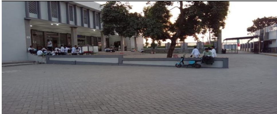
Gambar 4. Suasana Sebelum Magrib dimasjid sholahuddin wahid pesantren sains tebuireng pengurus sudah datang kemasjid untuk memberikan contoh teladan, memberi nasehat, dan menegur pada santri yang kedatangan terlambat.

Informal lain mengatakan, gus mughni misalnya menjelaskan didalam pondok perlu memperhatikan 2 aspek yakni taklim dan tarbiyah, artinya santri tidak hanya diberi pengetahuan semata tetapi harus diberikan tarbiyah seperti santri diberikan pengetahuan tentang tatacara sholat, wudhu, dan sebagainya sekaligus diberikan contoh/praktek secara langsung oleh pengurus dan pembina.