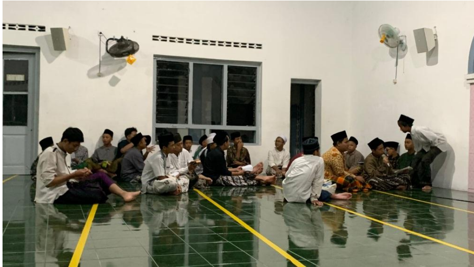
Gambar 13. Latihan Pidato Kegiatan Jamiyyah IMALAH